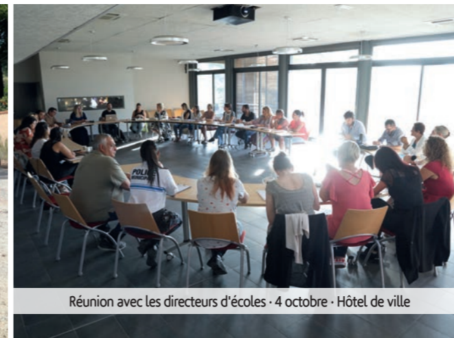
Réunion avec les directeurs d'écoles - 4 octobre - Hôtel de ville