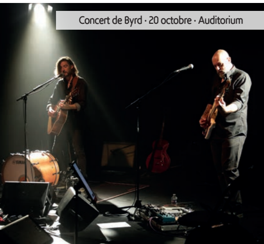
Concert de Byrd - 20 octobre - Auditorium