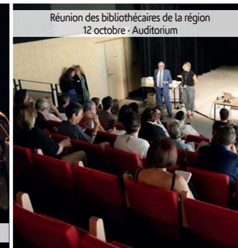
Réunion des bibliothécaires de la région 12 octobre - Auditorium