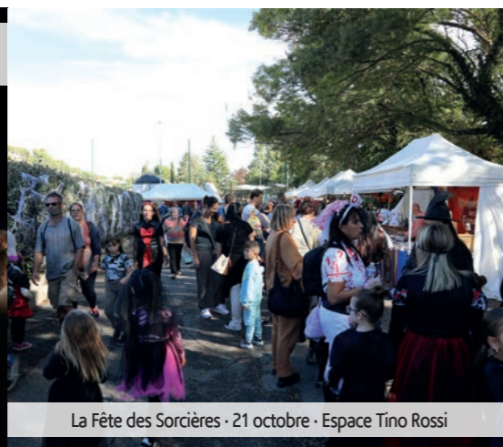
La Fête des Sorcières - 21 octobre - Espace Tino Rossi