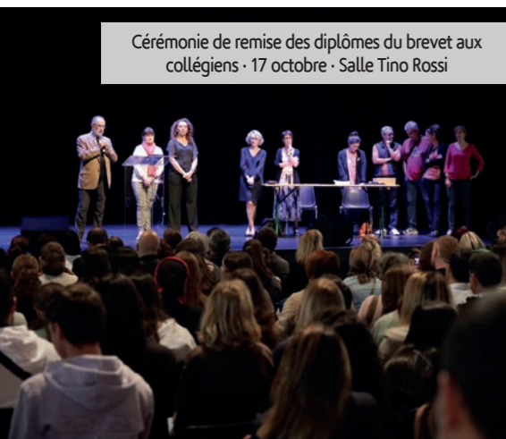
Cérémonie de remise des diplômes du brevet aux collégiens - 17 octobre - Salle Tino Rossi