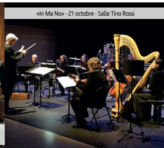
«In Ma No» - 21 octobre - Salle Tino Rossi