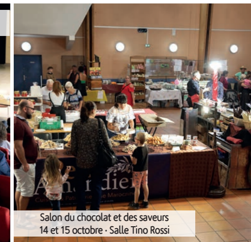
Salon du chocolat et des saveurs 14 et 15 octobre - Salle Tino Rossi