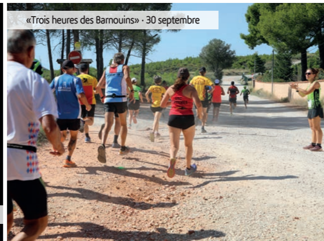
«Trois heures des Barnouins» - 30 septembre