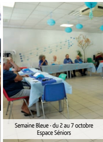
Semaine Bleue - du 2 au 7 octobre Espace Séniors