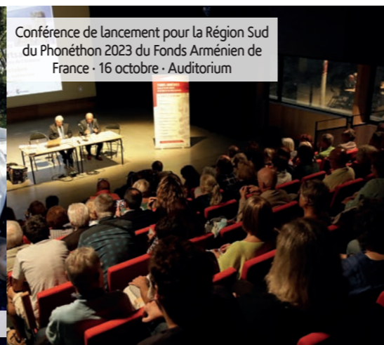
Conférence de lancement pour la Région Sud du Phonéthon 2023 du Fonds Arménien de France - 16 octobre - Auditorium