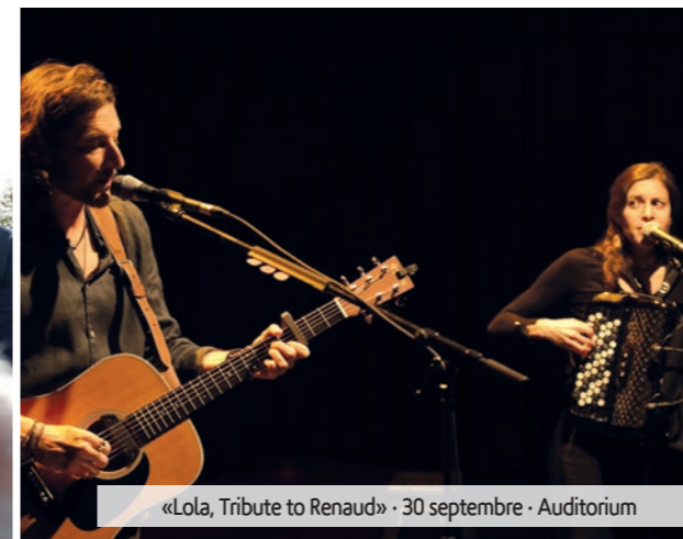
«Lola, Tribute to Renaud» - 30 septembre - Auditorium