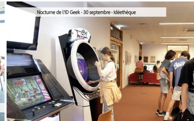
Nocturne de l'ID Geek - 30 septembre - Idéethèque