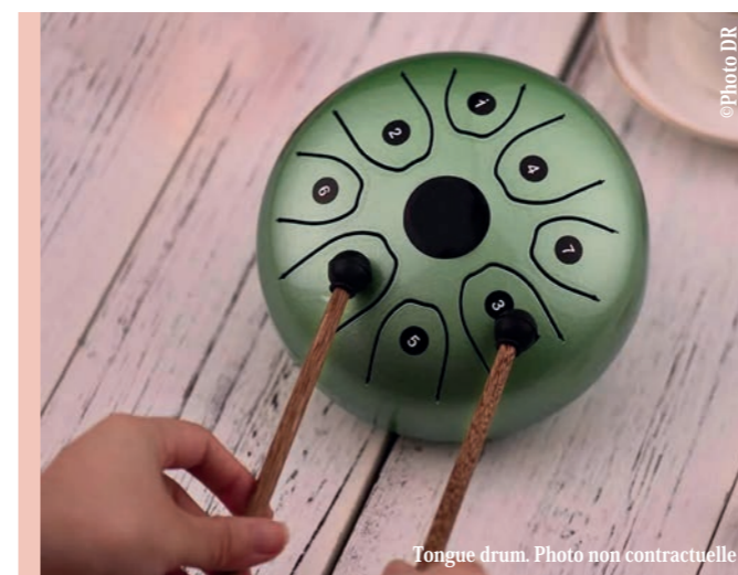
Tongue drum. Photo non contractuelle