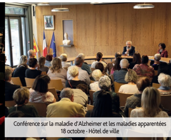
Conférence sur la maladie d'Alzheimer et les maladies apparentées 18 octobre - Hôtel de ville