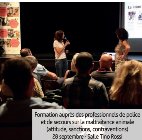
Formation auprès des professionnels de police et de secours sur la maltraitance animale (attitude, sanctions, contraventions) 28 septembre - Salle Tino Rossi