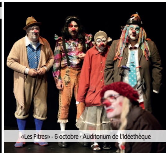
«Les Pitres» - 6 octobre - Auditorium de l'Idéethèque