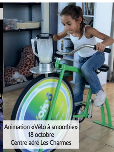
Animation «Vélo à smoothie» 18 octobre Centre aéré Les Charmes