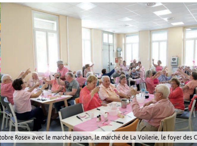
«Octobre Rose» avec le marché paysan, le marché de La Voilerie, le foyer des Cadeneaux, la piscine du Jas de Rhôdes, le spectacle de Zize,