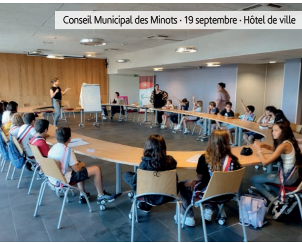
Conseil Municipal des Minots · 19 septembre · Hôtel de ville