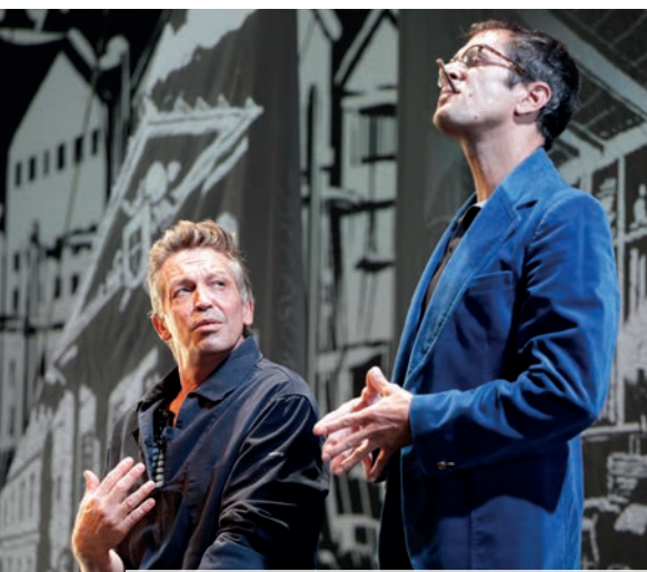
Festival Les Provençades · du 15 au 17 septembre · Village des Pennes : Le Comte de Monte-Cristo / L'eau en Provence / Marché Provençal / Laurent Febvay /