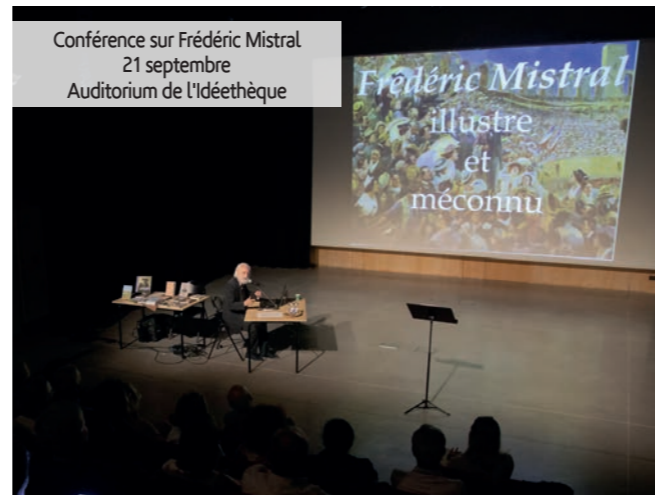
Conférence sur Frédéric Mistral 21 septembre Auditorium de l'Idéethèque