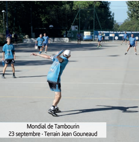
Mondial de Tambourin 23 septembre · Terrain Jean Gouneaud