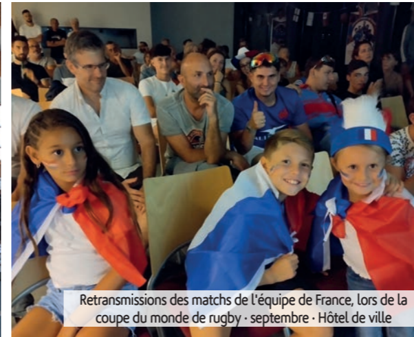
Retransmissions des matchs de l'équipe de France, lors de la coupe du monde de rugby · septembre · Hôtel de ville