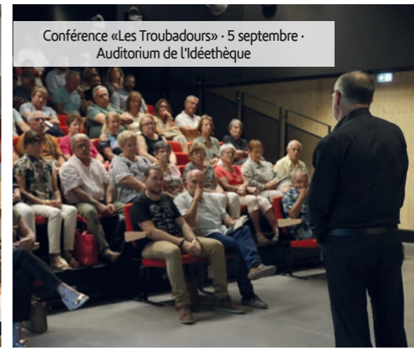
Conférence «Les Troubadours» · 5 septembre · Auditorium de l'Idéethèque