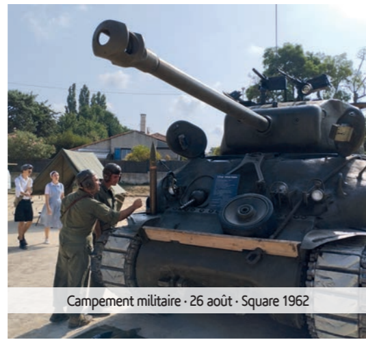
Campement militaire · 26 août · Square 1962