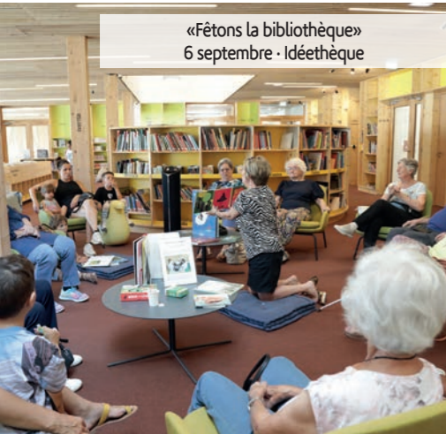
«Fêtons la bibliothèque» 6 septembre · Idéethèque