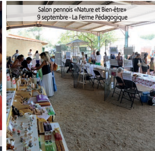
Salon pennois «Nature et Bien-être» 9 septembre · La Ferme Pédagogique