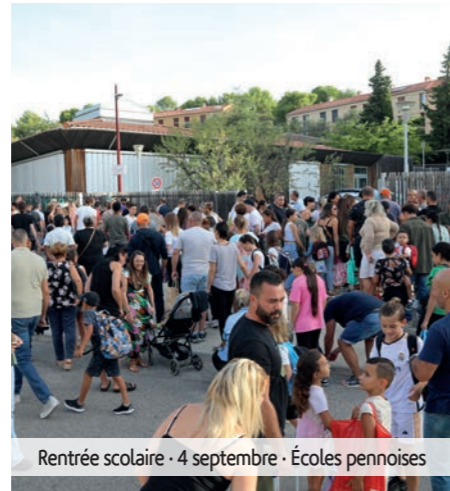
Rentrée scolaire · 4 septembre · Écoles pennoises