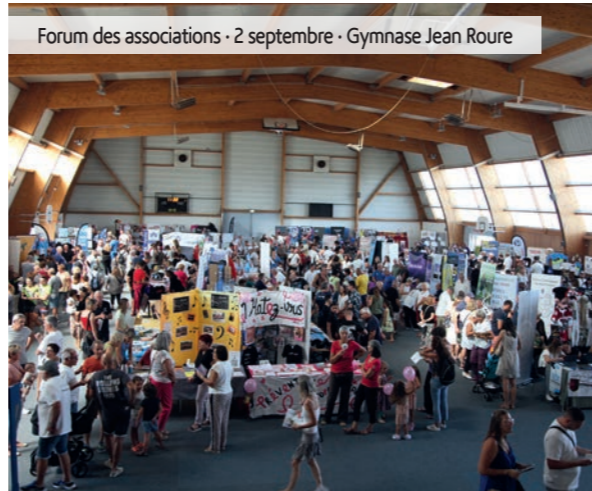
Forum des associations · 2 septembre · Gymnase Jean Roure