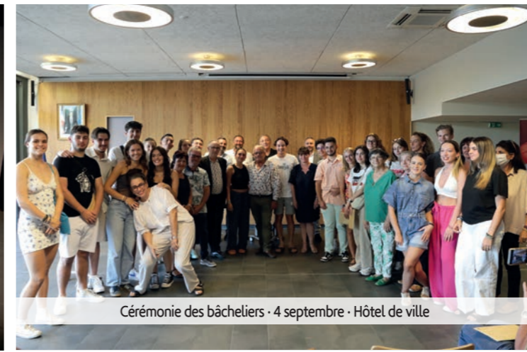
Cérémonie des bacheliers · 4 septembre · Hôtel de ville