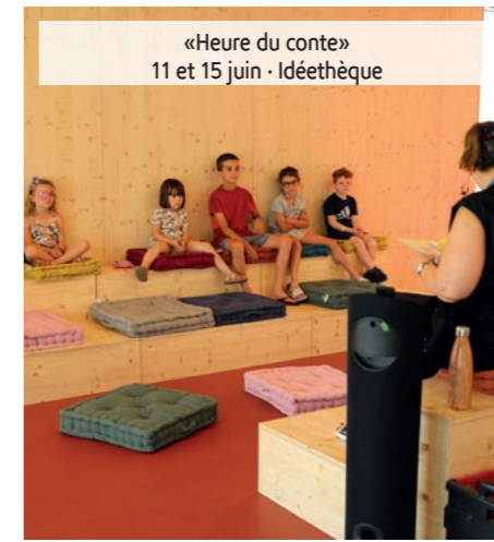
«Heure du conte» 11 et 15 juin - Idéethèque