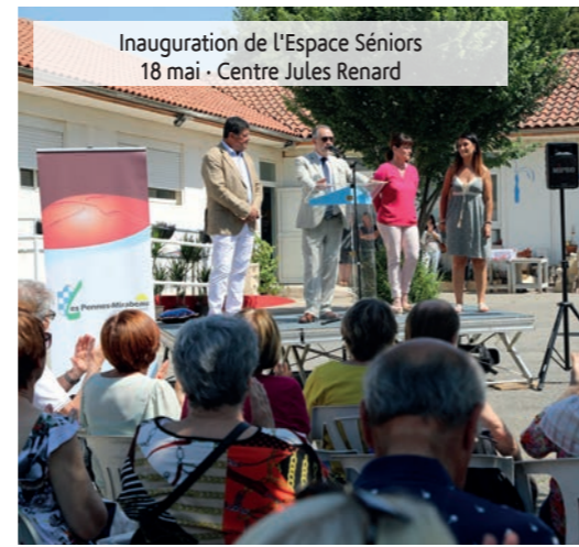
Inauguration de l'Espace Séniors 18 mai - Centre Jules Renard