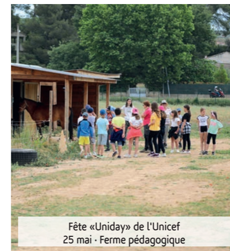
Fête «Uniday» de l'Unicef 25 mai - Ferme pédagogique