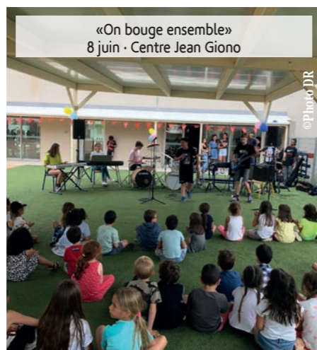
«On bouge ensemble» 8 juin - Centre Jean Giono