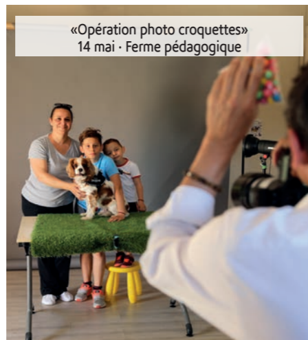
«Opération photo croquettes» 14 mai - Ferme pédagogique