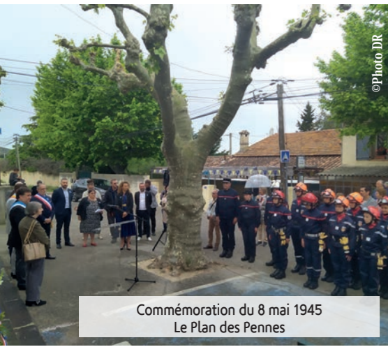
Commemoration du 8 mai 1945 Le Plan des Pennes