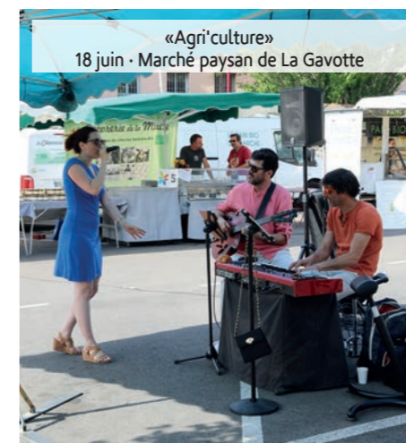
«Agri'culture» 18 juin - Marché paysan de La Gavotte