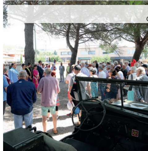
Commemoration de l'Appel du 18 juin 1940 Cérémonie - Exposition de véhicules - Spectacle L'Appel