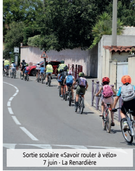
Sortie scolaire «Savoir rouler à vélo» 7 juin - La Renardière