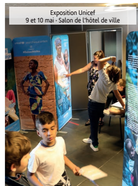
Exposition Unicef 9 et 10 mai - Salon de l'hôtel de ville