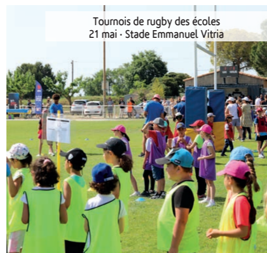
Tournois de rugby des écoles 21 mai - Stade Emmanuel Vitria