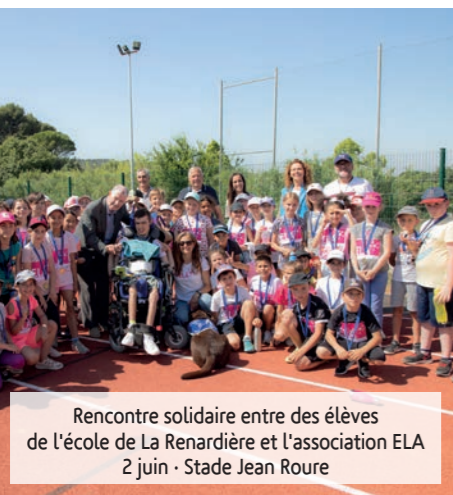
Rencontre solidaire entre des élèves de l'école de La Renardière et l'association ELA 2 juin - Stade Jean Roure