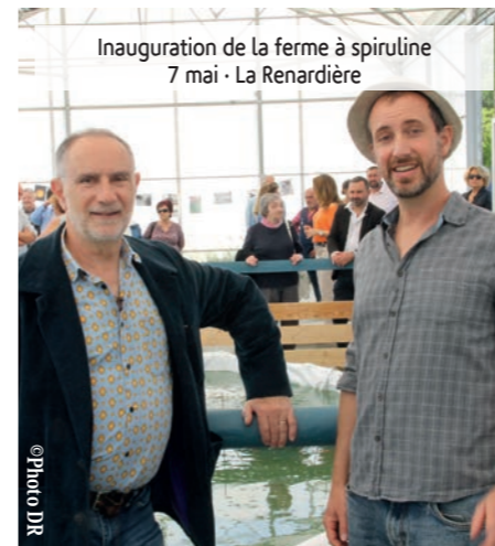
Inauguration de la ferme à spiruline 7 mai - La Renardière