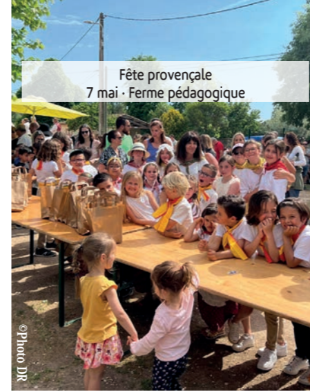
Fête provençale 7 mai - Ferme pédagogique