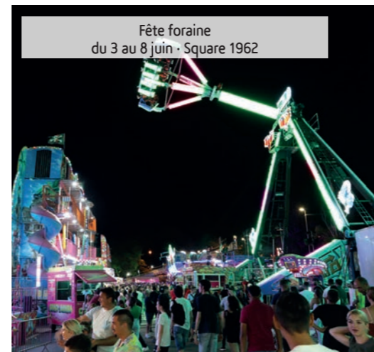
Fête foraine du 3 au 8 juin - Square 1962