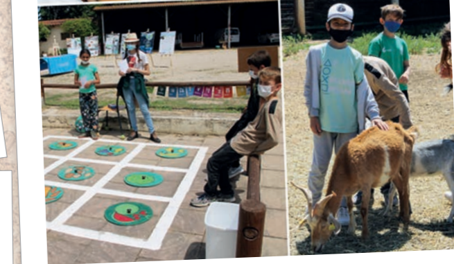
Journée Uniday de l'Unicef dédiée à l'environnement : - à la ferme pédagogique en présence des enfants de l'ALSH Les Charmes et de 10 éco-délégués du collège Jacques Monod - à l'ALSH Jean Giono 26 mai