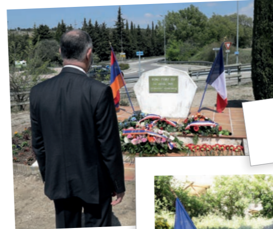
Commérorations des 24, 25 avril et 8 mai