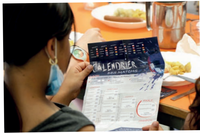
Mois dédié à l'Euro de foot dans les restaurants scolaires pennois du 31 mai au 25 juin