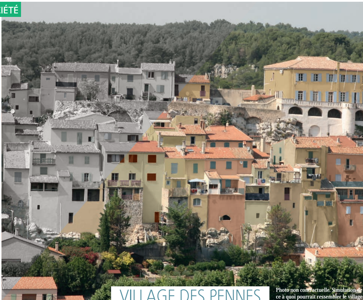
VILLAGE DES PENNES

Photo non contractuelle. Simulation de ce à quoi pourrait ressembler le village