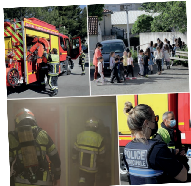
Exercice incendie avec les pompiers et la Police municipale 21 mai - Ecole des Cadeneaux