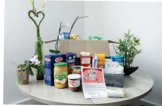
Distribution de colis solidaires par le CCAS - 26 avril