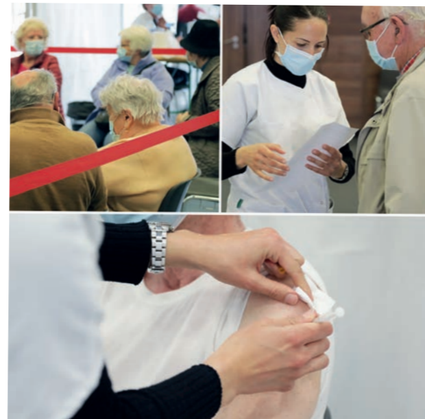
Vaccination des Pennois - depuis le 15 mars - Salle Guy Obino, Vitrolles