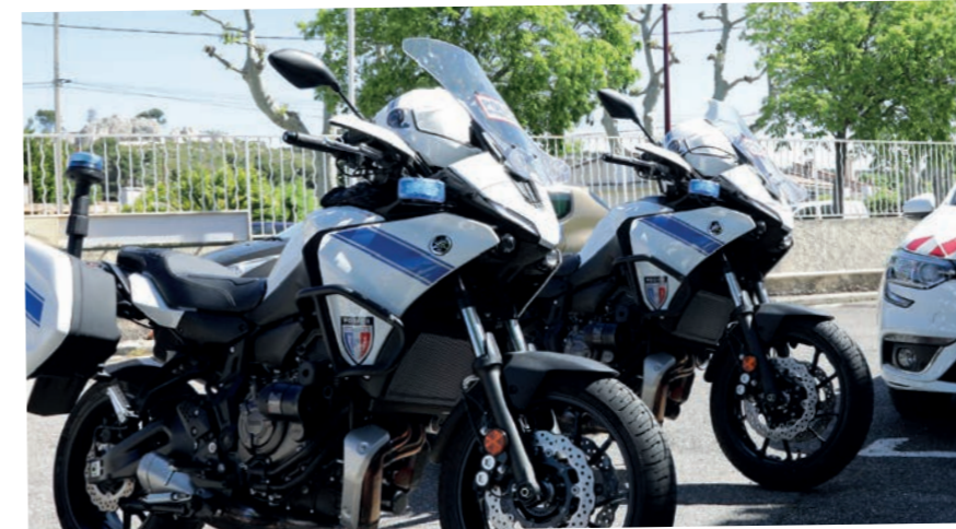
La Police Municipale s'équipe de deux motos supplémentaires - 12 mai