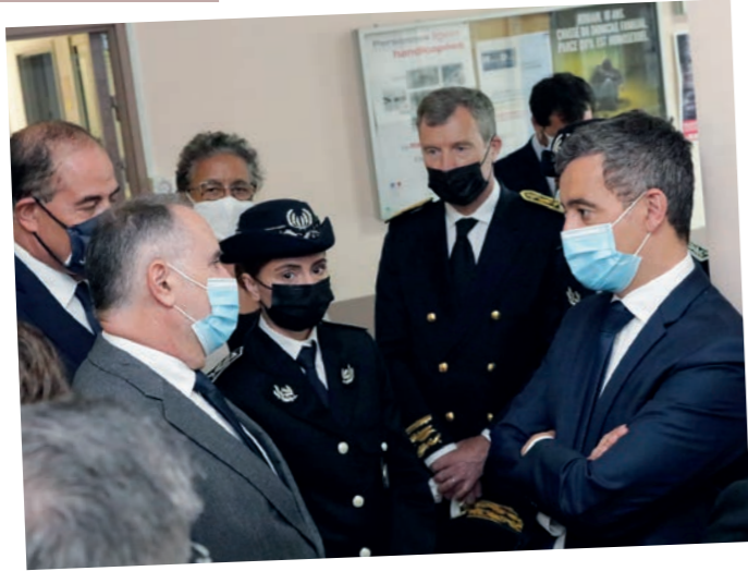
Venue du ministre de l'Intérieur Gérard Darmanin 24 mai - Commissariat de La Gavotte