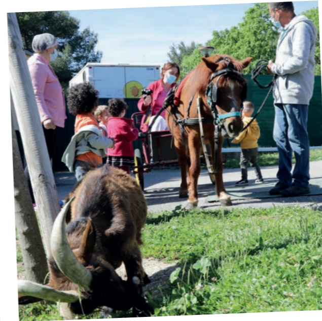
Animation «ferme» à la crèche des Bouroumettes - 20 mai