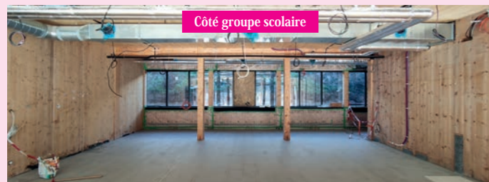
Côté groupe scolaire

Travaux d'élargissement du trottoir au niveau du Clos Cadanel.