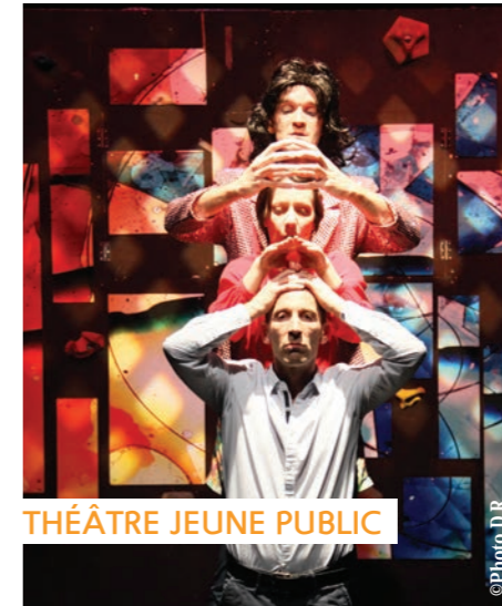
THÉÂTRE JEUNE PUBLIC

Vendredi 12 mars | 20h30 Espace Tino Rossi Tarifs : 11€ et 8€ Renseignements : 04 91 67 17 79