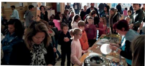
Opération «Petit déjeuner à l'école» - du 1 er au 15 octobre