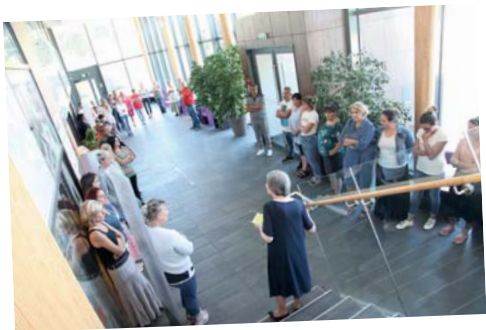
Hommage à Jacques Chirac - 30 septembre - Hôtel de Ville