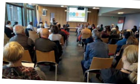
Réunion publique sur le PLUi (Plan local d'urbanisme intercommunal) 7 octobre - Hôtel de Ville