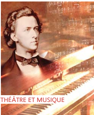
THÉÂTRE ET MUSIQUE