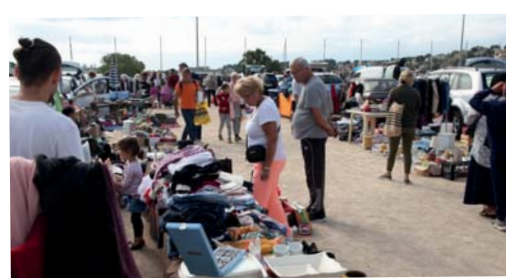
Vide grenier du Comité des fêtes - 13 octobre - Stade Gilbert Rocci