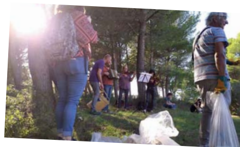
Nettoyage orchestré du Val Sec - 28 septembre