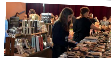
Salon du chocolat et des saveurs - 19 et 20 octobre - Espace Tino Rossi