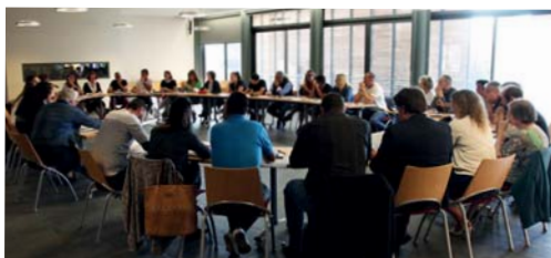
Réunion des directeurs d'écoles - 2 octobre - Hôtel de Ville