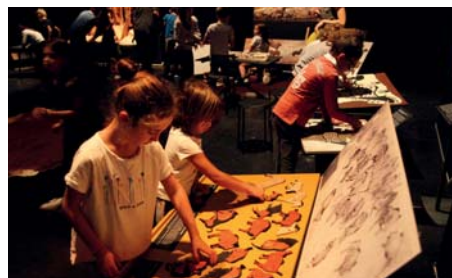
Exposition «Toucher l'art des cavernes» du 2 au 8 octobre - La Capelane