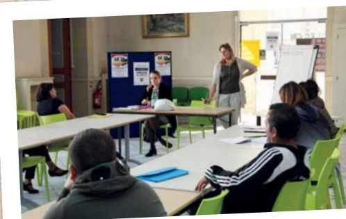
«Markethon» de l'emploi - 17 octobre