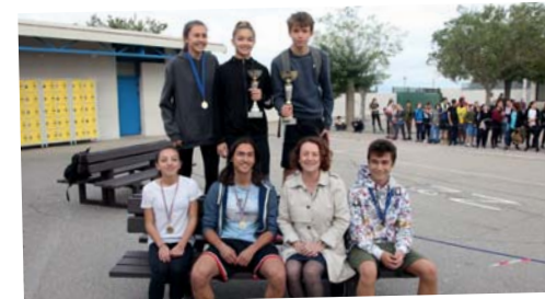
CROSS du collège Jacques Monod - 18 octobre