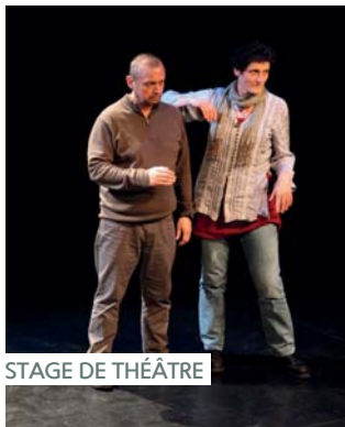
STAGE DE THÉÂTRE

Dimanche 24 novembre 10h-12h30/14h30-18h30 Espace Tino Rossi Gratuit Renseignements : 04 42 02 03 33