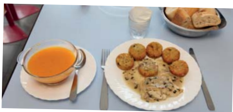
«Semaine du goût» - du 7 au 11 octobre - Restaurants scolaires