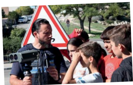
Opération sécurité routière - 8 octobre - Collège Jacques Monod