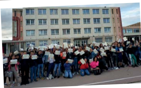
Remise des diplômes du brevet - 17 octobre - Collège Jacques Monod