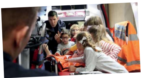
Visite au centre de secours dans le cadre de la «Semaine du respect» pour des classes de CE2 et CM1 - 14 octobre