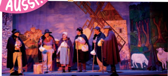
La Pastorale Maurel - 20 janvier - Jas Rod