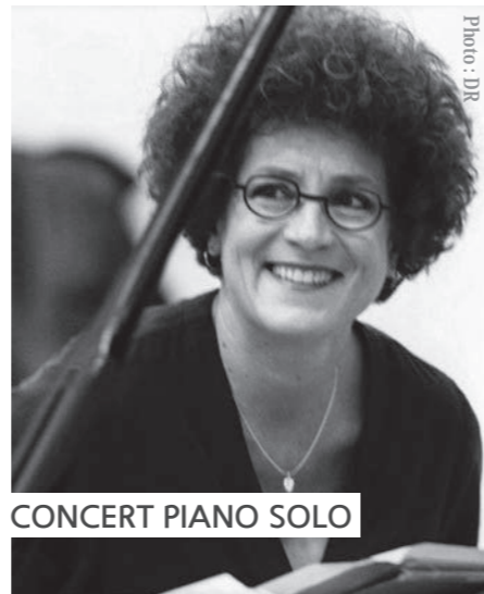
CONCERT PIANO SOLO