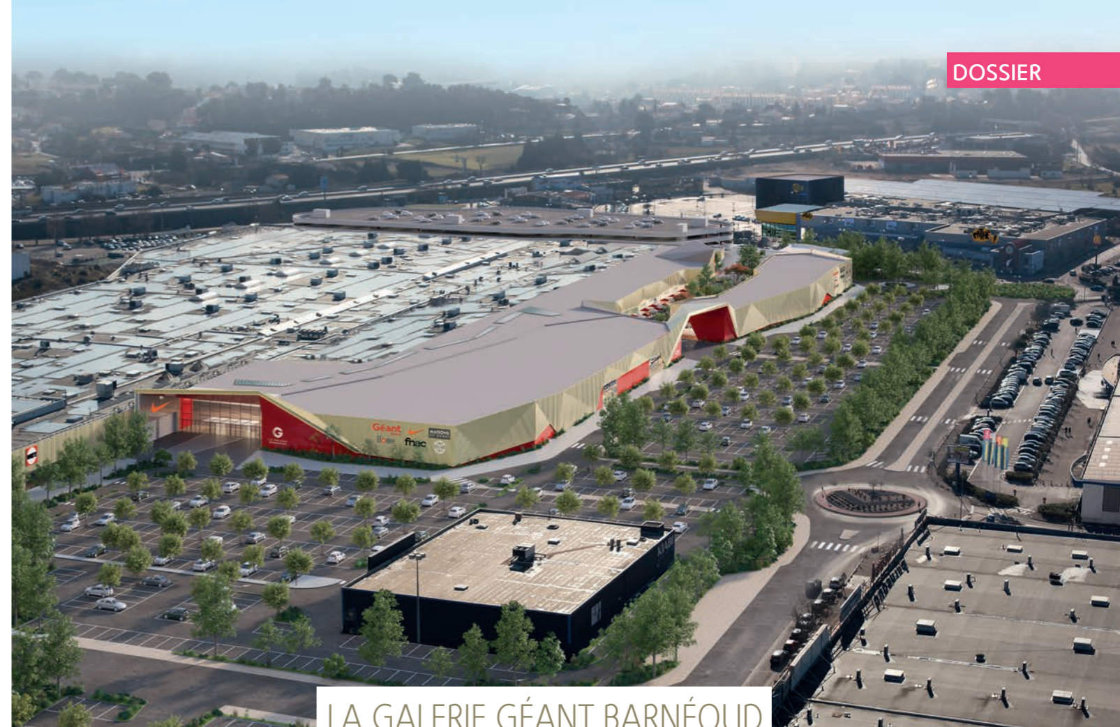
LA GALERIE GÉANT BARNÉOUD