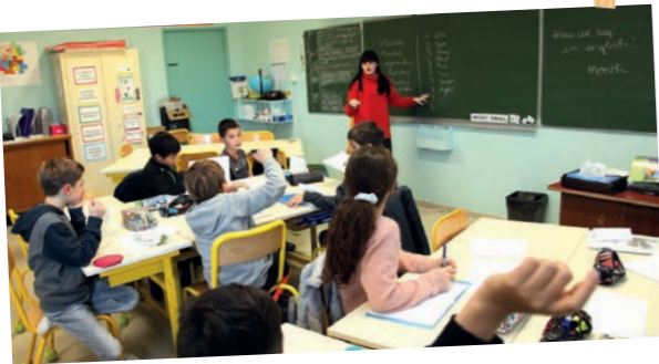
Atelier «Coup de pouce en anglais» Depuis le 14 janvier - Écoles des Pennes-Mirabeau