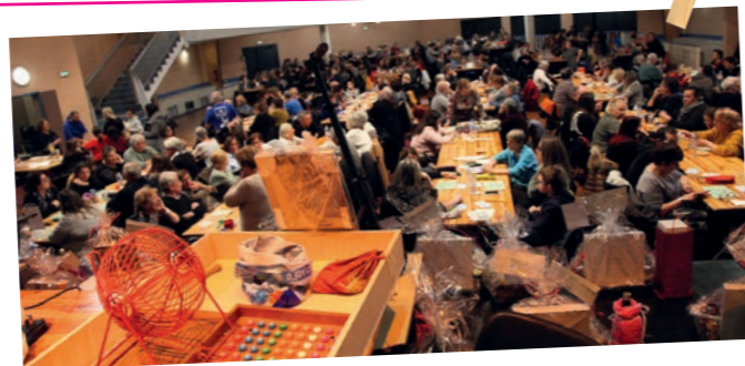
Lotos pennois - De novembre à janvier