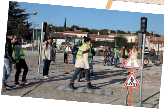
Opération sécurité routière 22 janvier - École de La Voilerie