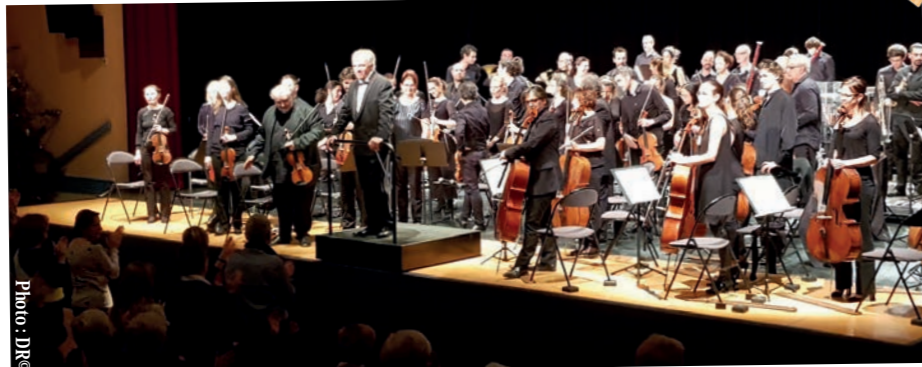
Orchestre philharmonique du Pays d'Aix - 13 janvier - Espace Tino Rossi