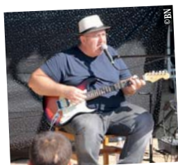
Journée portes ouvertes 13 octobre - La Ferme pédagogique