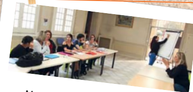
Markethon de l'emploi - 18 octobre