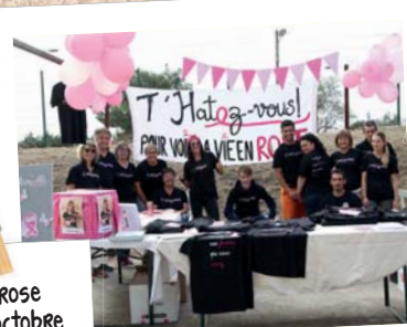
Stand de l'association T'Hâtez-vous!