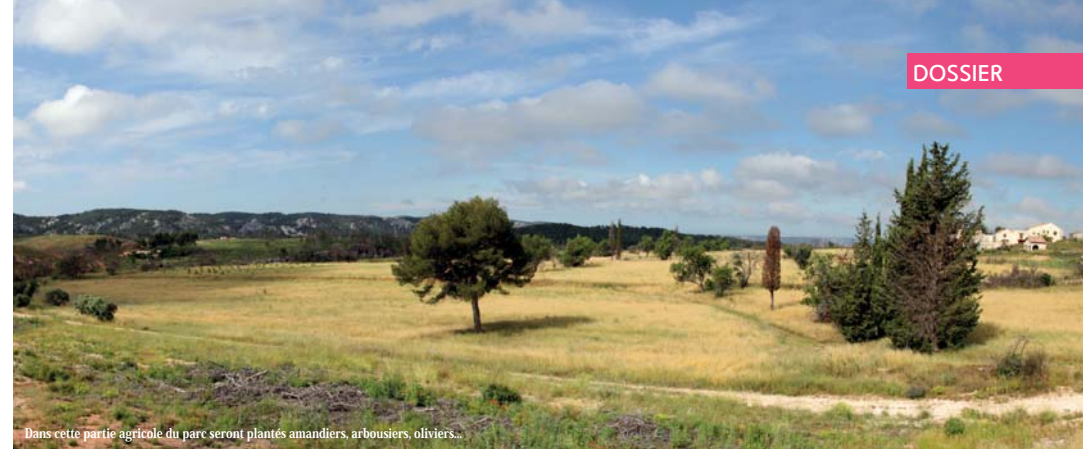
Dans cette partie agricole du parc seront plantés amandiers, arbusiers, oliviers...