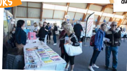
Semaine bleue du 8 au 13 octobre