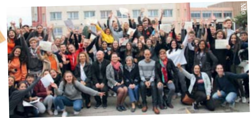
Remise des diplômes du Brevet des collèges 16 octobre - Collège Jacques Monod