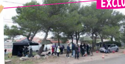
Tournoi «Plus belle la vie» 17 octobre - La Voilerie