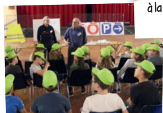
Journée de sensibilisation à la sécurité routière 11 octobre