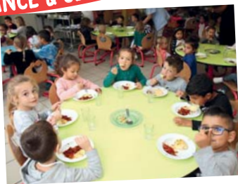
Semaine du goût dans les cantines du 8 au 12 octobre