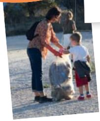
Opération «Jas propre» 28 septembre - Jas de Rhodés