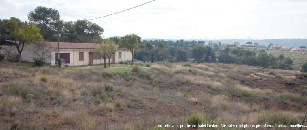
Sur cette zone proche du chalet Frédéric Mistral seront plantés pistachiers, érables, prunelliers...