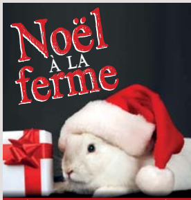
MARCHÉ DE NOËL - (SPECTACLES) ANIMATIONS | PHOTO AVEC LE PÈRE NOËL