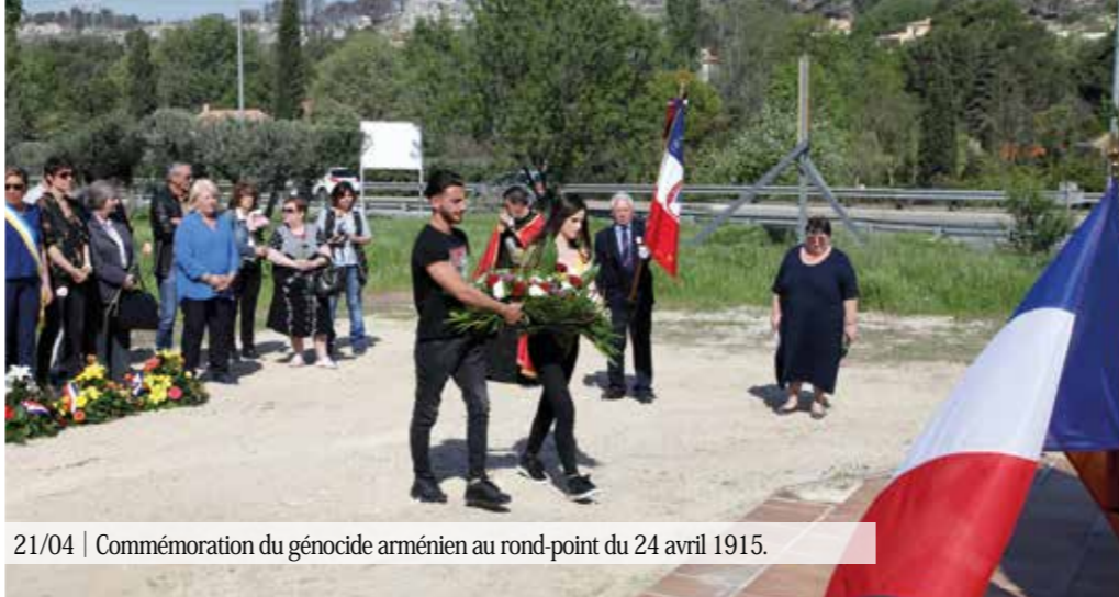
21/04 | Commémoration du génocide arménien au rond-point du 24 avril 1915.