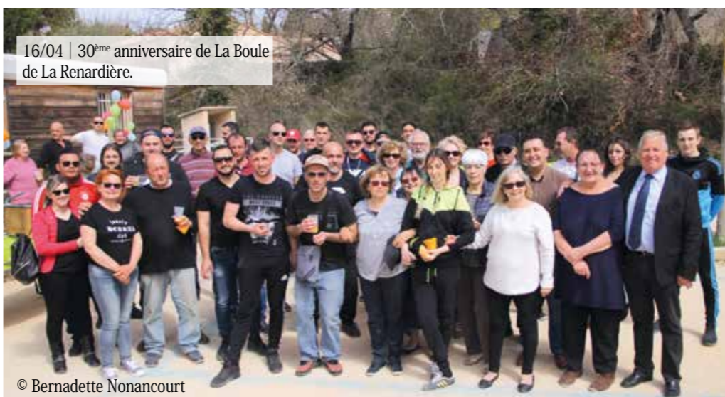
16/04 | 30 ème anniversaire de La Boule de La Renardière.