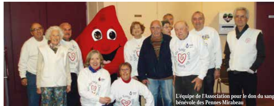
L'équipe de l'Association pour le don du sang bénévole des Pennes-Mirabeau

le rappellent les concepteurs de cette fête créée en 1999. Parmi les 25 millions de participants, dont 8,5 en moyenne en France, on compte de nombreux Pennois. Comme pour les précédentes éditions, ils peuvent contacter la mairie qui fait partie des villes partenaires ; elle peut leur fournir des outils de communication aux couleurs de ce rendez-vous (tél. 09 69 36 24 12).