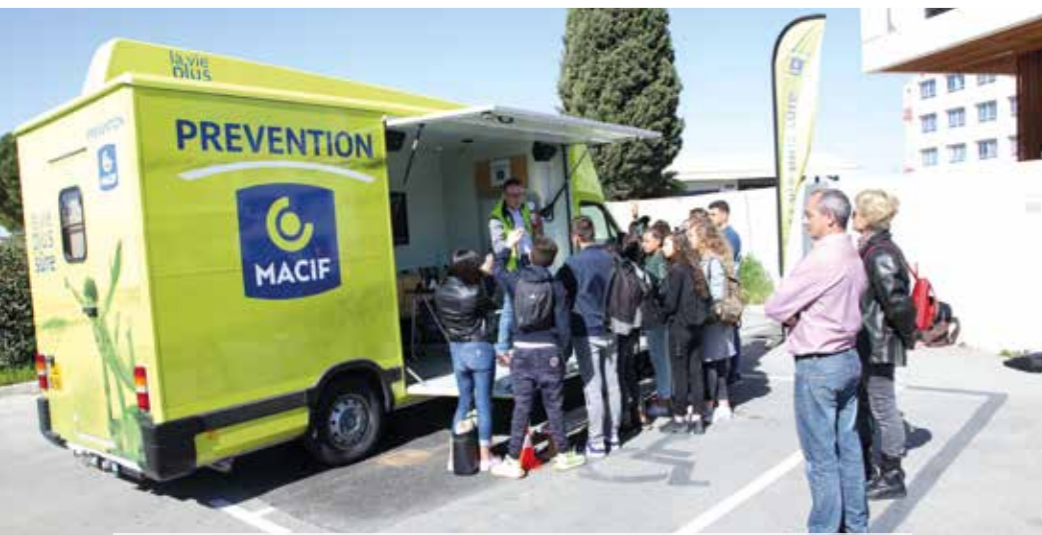
6/04 | Action prévention routière et dangers de l'alcool au collège Jacques Monod.