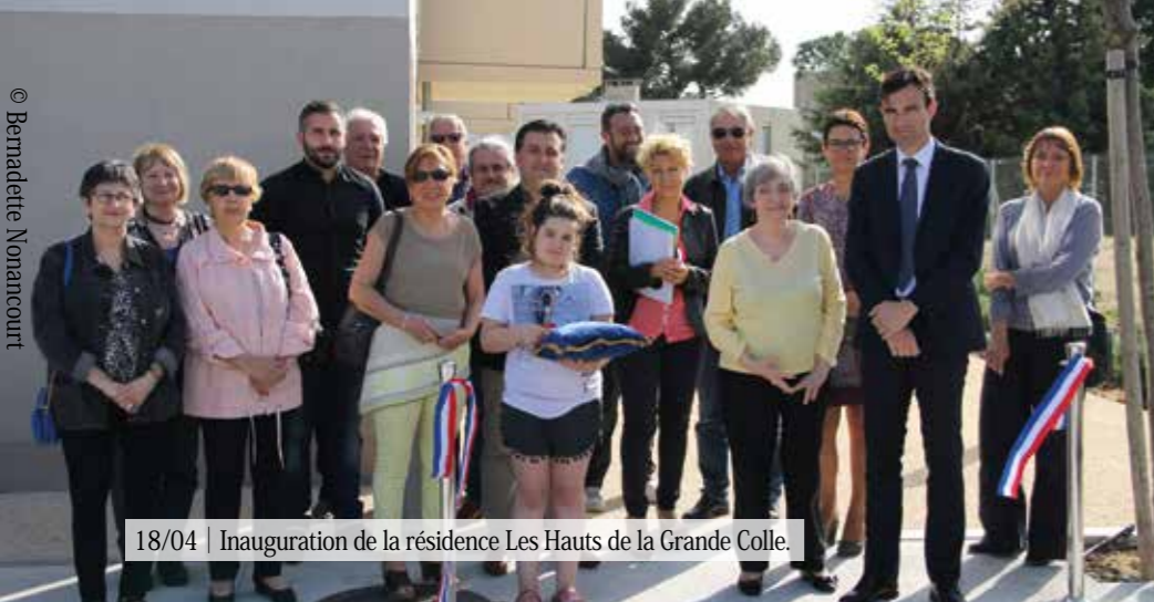
18/04 | Inauguration de la résidence Les Hauts de la Grande Colle.