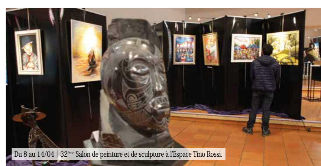
Du 8 au 14/04 | 32 ème Salon de peinture et de sculpture à l'Espace Tino Rossi.