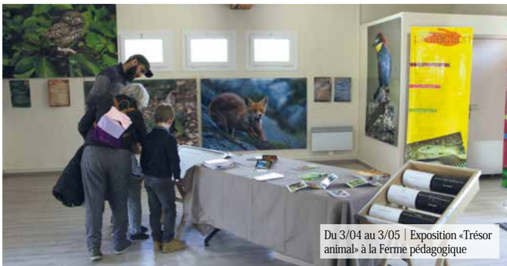
Du 3/04 au 3/05 | Exposition «Trésor animal» à la Ferme pédagogique