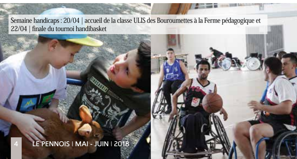
Semaine handicaps : 20/04 | accueil de la classe ULIS des Bouroumettes à la Ferme pédagogique et 22/04 | finale du tournoi handibasket