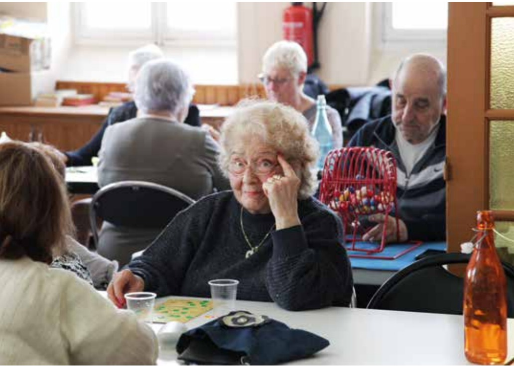
Après-midi loto au foyer des Cadeneaux