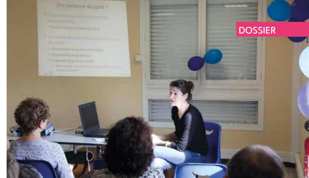
Ci-dessus, conférence sur les aidants