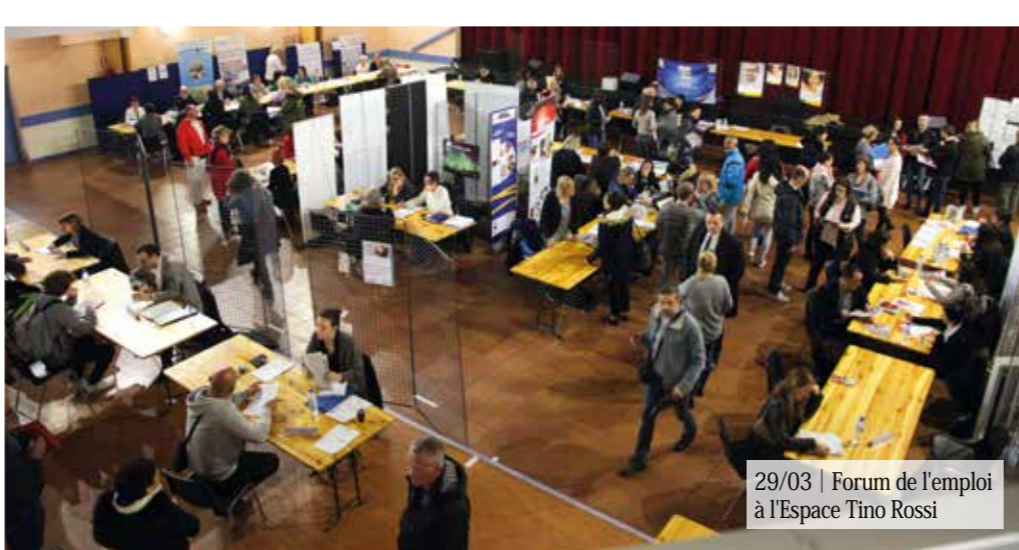
29/03 | Forum de l'emploi à l'Espace Tino Rossi