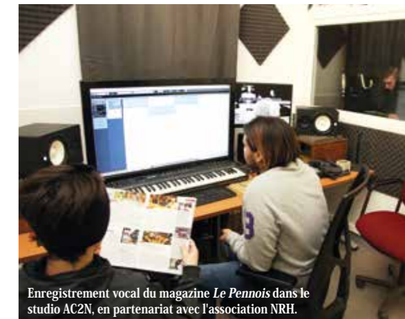
Enregistrement vocal du magazine Le Pennois dans le studio AC2N, en partenariat avec l'association NRH.