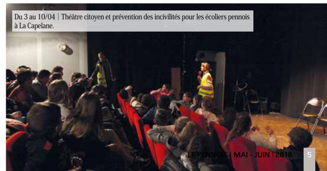
Du 3 au 10/04 | Théâtre citoyen et prévention des incivilités pour les écoliers pennois à La Capelane.