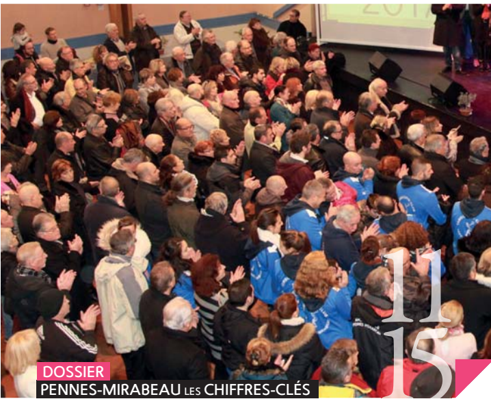
DOSSIER PENNES-MIRABEAU LES CHIFFRES-CLÉS