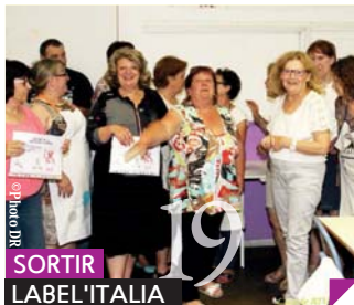
19 SORTIR LABEL'ITALIA