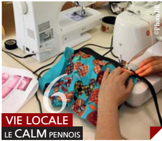
VIE LOCALE LE CALM PENNOIS