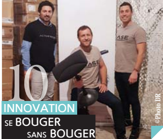
10 INNOVATION SE BOUGER SANS BOUGER