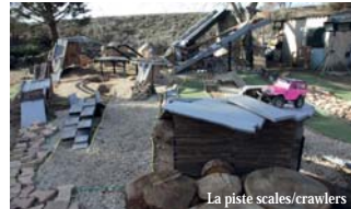
La piste scales/crawlers