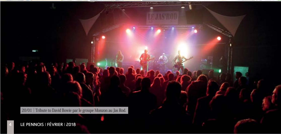
20/01 | Tribute to David Bowie par le groupe Monzon au Jas Rod.