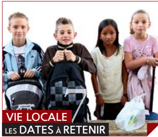
VIE LOCALE LES DATES À RETENIR