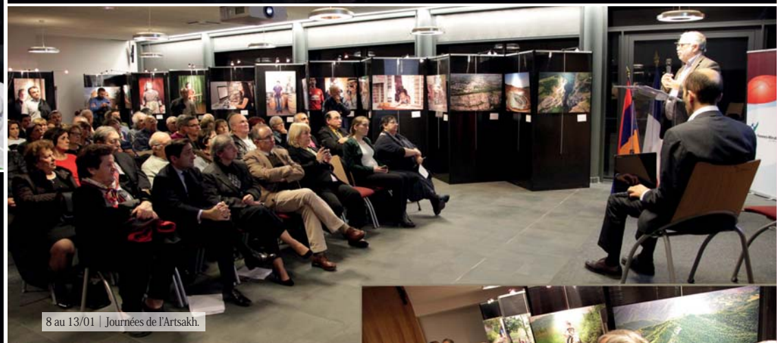
8 au 13/01 | Journées de l'Artsakh.