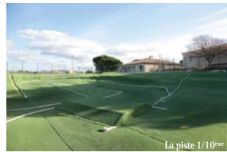
La piste 1/10 ème