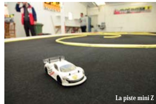
La piste mini Z