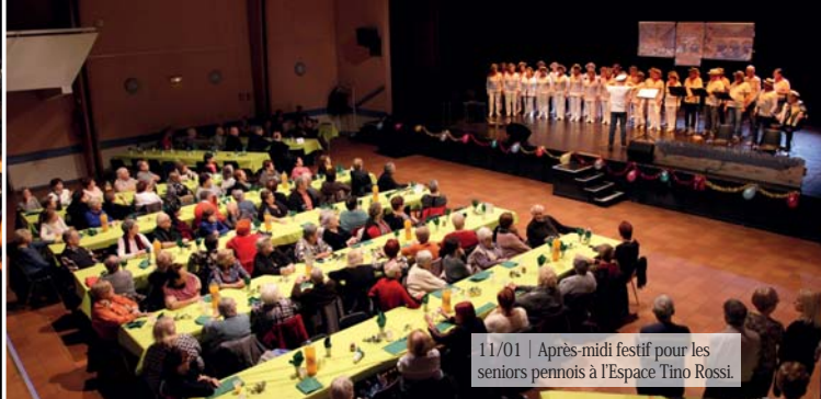
11/01 | Après-midi festif pour les seniors pennois à l'Espace Tino Rossi.