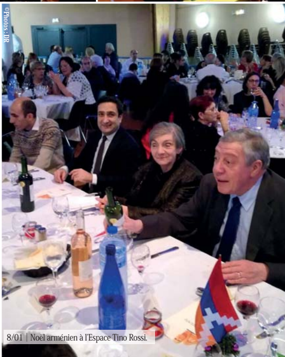
8/01 | Noël arménien à l'Espace Tino Rossi.