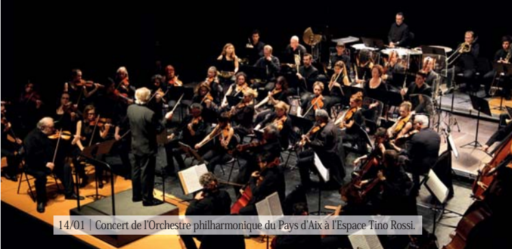
14/01 | Concert de l'Orchestre philharmonique du Pays d'Aix à l'Espace Tino Rossi.