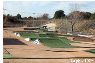
La piste 1/8 ème

Tout est fait pour que les adhérents trouvent leur bonheur sur place. Compresseur, électricité – mais aussi buvette – sont à leur disposition. Et puis, il y a cette volonté constante de s'améliorer qui permet au club pennois d'accueillir des compétitions internationales. Exemple : la rénovation récente de la piste 1/8 ème ... sans oublier que l'équipe du Mini-racing songe déjà à la création d'une nouvelle piste en terre pour les véhicules 1/10 ème . Bonne route!