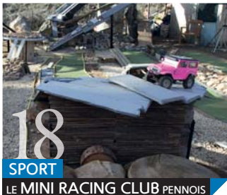
18 SPORT LE MINI RACING CLUB PENNOIS