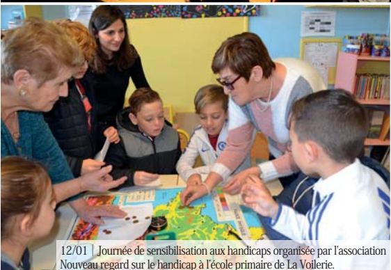
12/01 | Journée de sensibilisation aux handicaps organisée par l'association Nouveau regard sur le handicap à l'école primaire de La Voilerie.