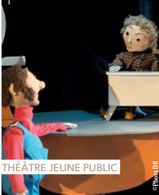
THÉÂTRE JEUNE PUBLIC