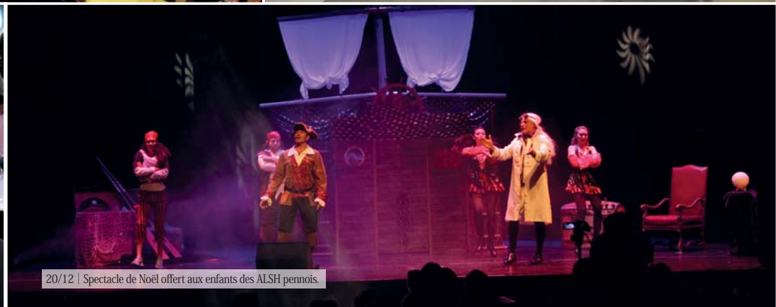
20/12 | Spectacle de Noël offert aux enfants des ALSH pennois.