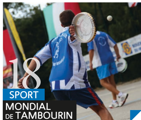
18 SPORT MONDIAL DE TAMBOURIN