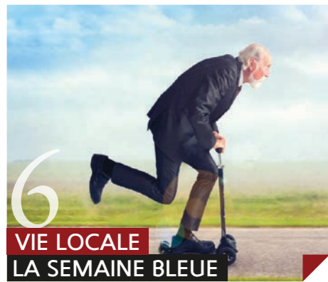
6 VIE LOCALE LA SEMAINE BLEUE