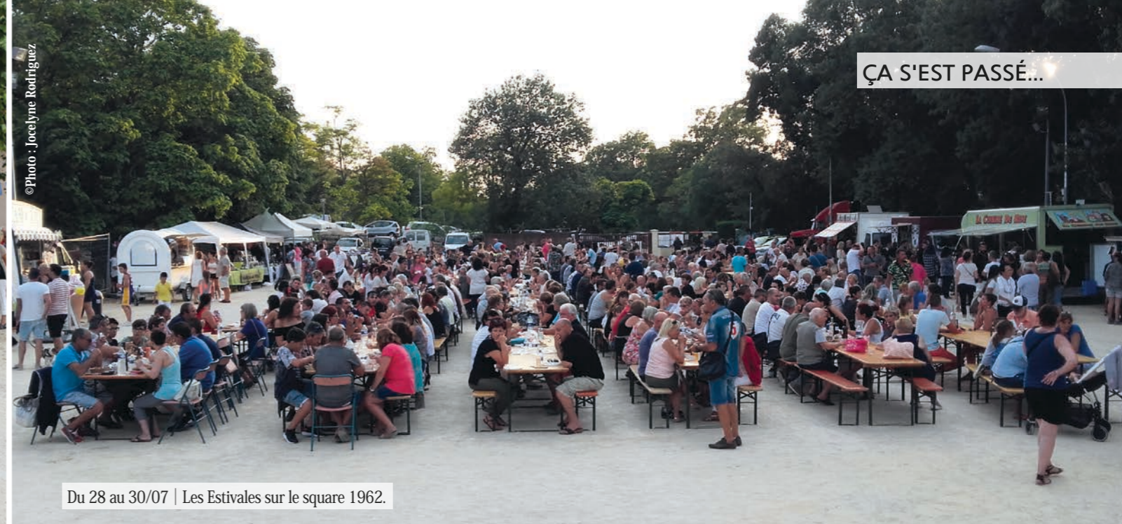
Du 28 au 30/07 | Les Estivales sur le square 1962.