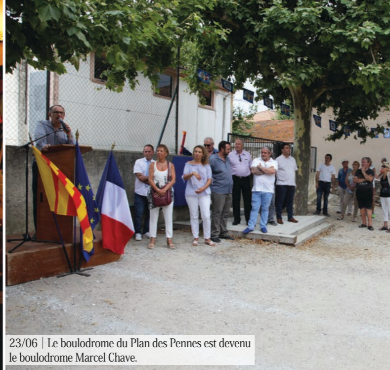
23/06 | Le boulodrome du Plan des Pennes est devenu le boulodrome Marcel Chave.