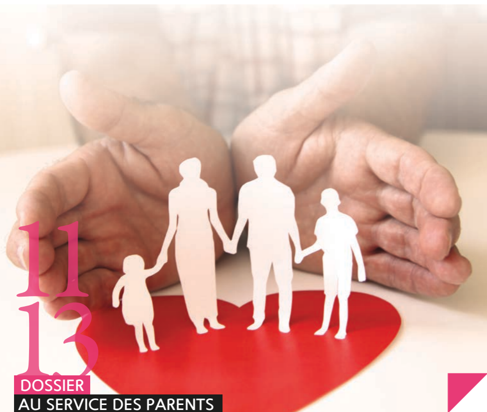
11 13 DOSSIER AU SERVICE DES PARENTS