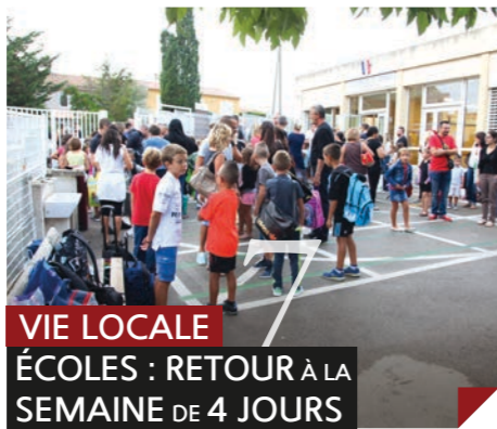
VIE LOCALE ÉCOLES : RETOUR À LA SEMAINE DE 4 JOURS