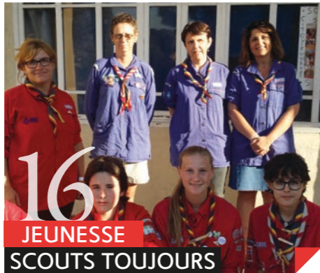
16 JEUNESSE SCOUTS TOUJOURS