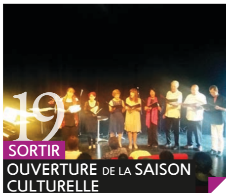
19 SORTIR OUVERTURE DE LA SAISON CULTURELLE