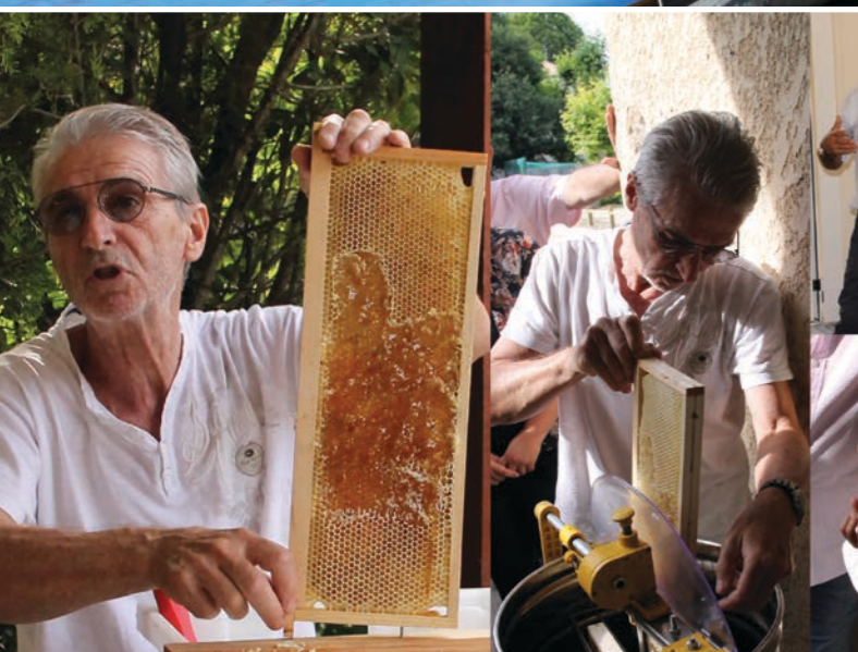
Du 8 au 22/06 | L'exposition «Le monde des abeilles» à la Ferme pédagogique.