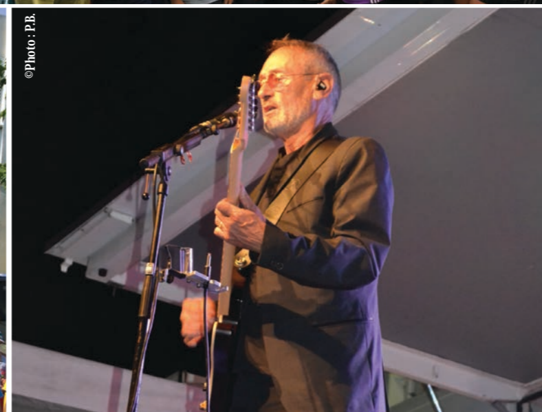
22/07 | La Tournée de La Marseillaise sur le stade Gilbert Rocci avec en vedette Michael Jones.