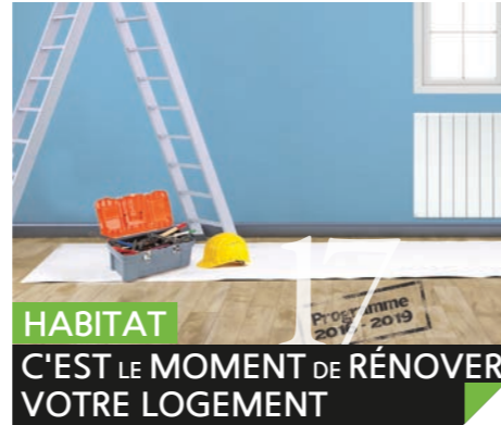
HABITAT C'EST LE MOMENT DE RÉNOVER VOTRE LOGEMENT