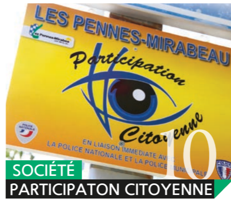
SOCIÉTÉ PARTICIPATION CITOYENNE