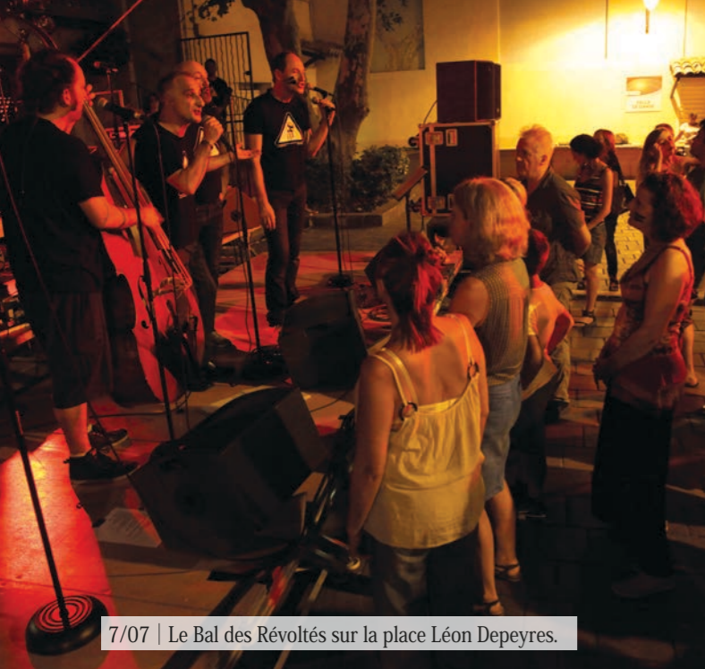
7/07 | Le Bal des Révoltés sur la place Léon Depeyres.