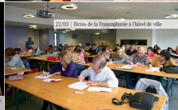
22/03 | Dictée de la Francophonie à l'hôtel de ville