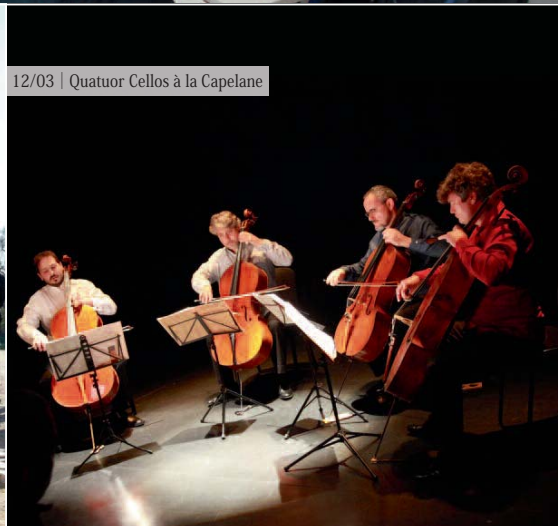
12/03 | Quatuor Cellos à la Capelane