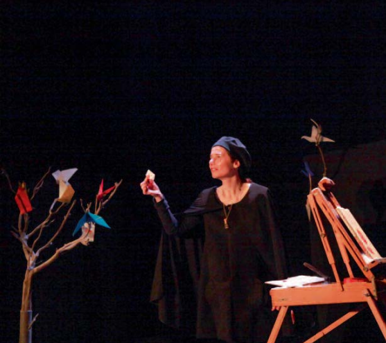
11/03 | Théâtre jeunesse avec Oiseau vole à la Capelane