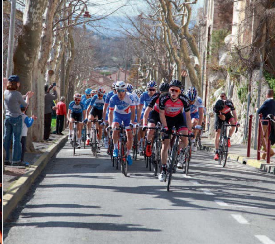
22/02 | Les cyclistes du Tour de Provence passent par le village des Pennes