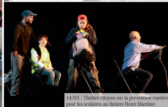
14/03 | Théâtre citoyen sur la prévention routière pour les scolaires au théâtre Henri Martinet