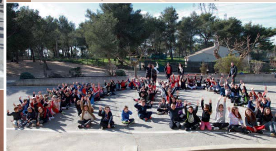
3/03 | Les enfants de l'école de la Voilerie célèbrent leur 100 ème jour d'École, tout comme ceux des Cadeneaux