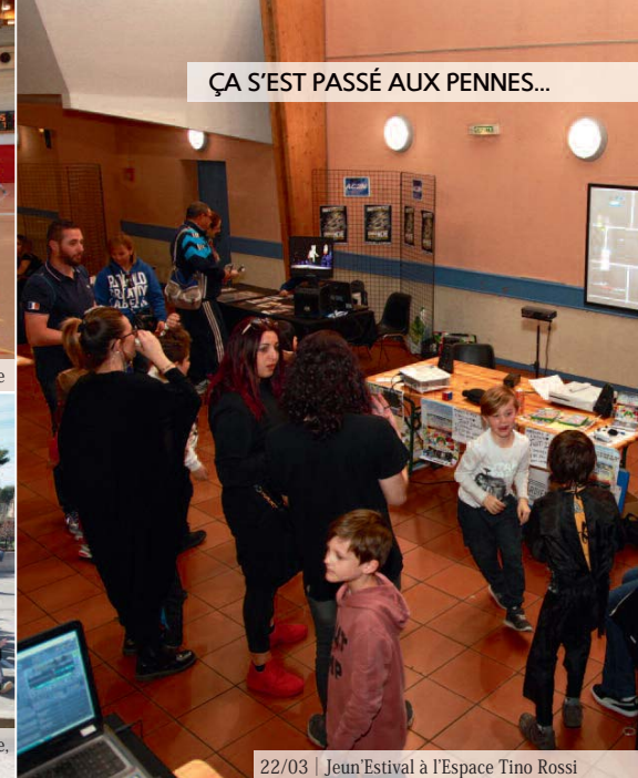
ÇA S'EST PASSÉ AUX PENNES...