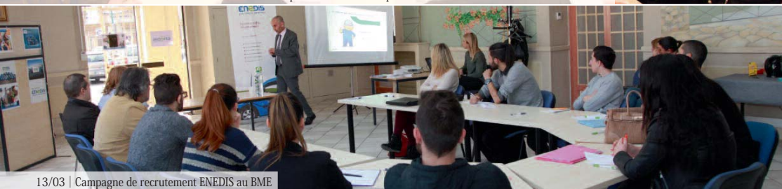
13/03 | Campagne de recrutement ENEDIS au BME