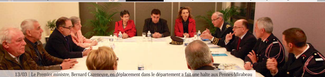
13/03 | Le Premier ministre, Bernard Cazeneuve, en déplacement dans le département a fait une halte aux Pennes-Mirabeau