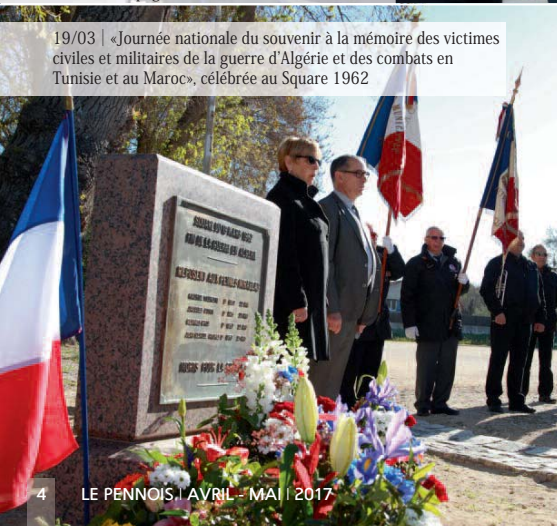
19/03 | «Journée nationale du souvenir à la mémoire des victimes civiles et militaires de la guerre d'Algérie et des combats en Tunisie et au Maroc», célébrée au Square 1962