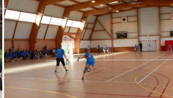
Du 3 au 5/03 | Championnat de France de Tambourin au gymnase Jean Roure