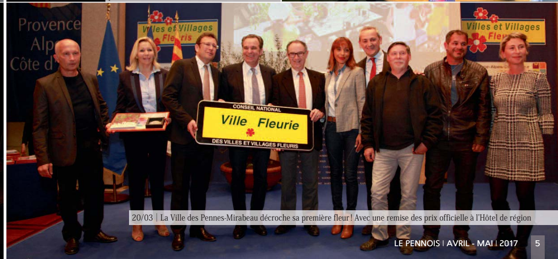
20/03 | La Ville des Pennes-Mirabeau décroche sa première fleur ! Avec une remise des prix officielle à l'Hôtel de région