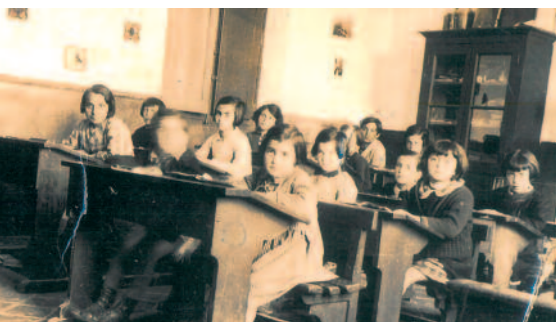
La classe unique