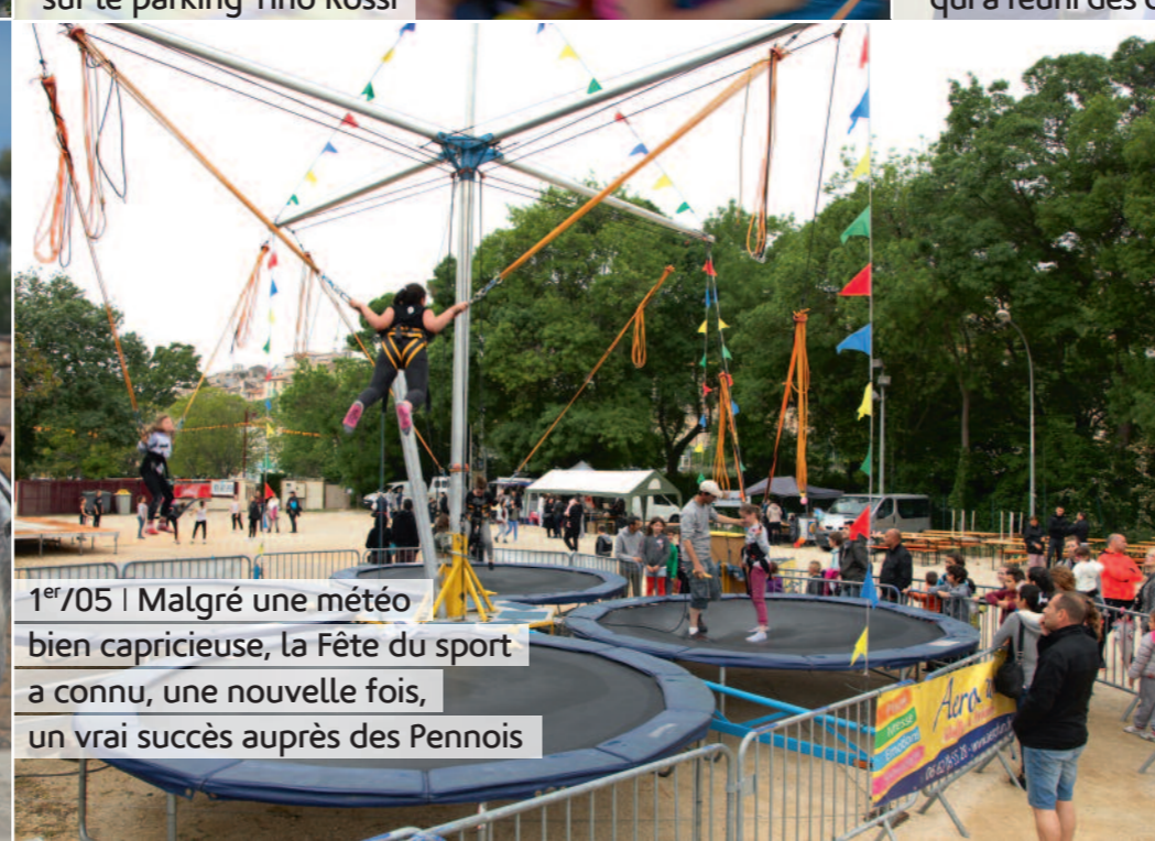
1 er /05 | Malgré une météo bien capricieuse, la Fête du sport a connu, une nouvelle fois, un vrai succès auprès des Pennois