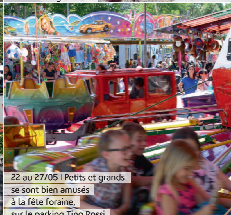
22 au 27/05 | Petits et grands se sont bien amusés à la fête foraine, sur le parking Tino Rossi