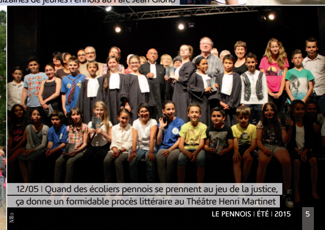
12/05 | Quand des écoliers pennois se prennent au jeu de la justice, ça donne un formidable procès littéraire au Théâtre Henri Martinet