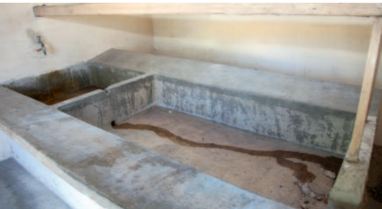
Le lavoir, qui n'est évidemment plus en fonction