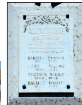
La plaque commémorative située Square Francis Malausse