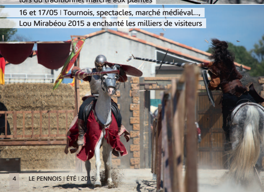
16 et 17/05 | Tournois, spectacles, marché médiéval..., Lou Mirabéou 2015 a enchanté les milliers de visiteurs