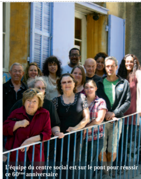
L'équipe du centre social est sur le pont pour réussir ce 60 ème anniversaire