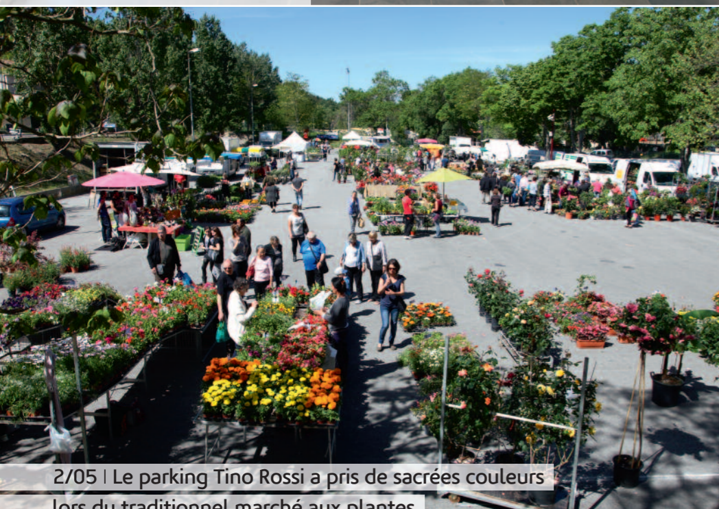
2/05 | Le parking Tino Rossi a pris de sacrées couleurs lors du traditionnel marché aux plantes