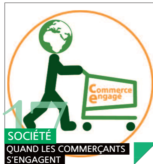
SOCIÉTÉ QUAND LES COMMERÇANTS S'ENGAGENT