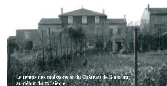
Le temps des moissons et du Château de Bouscaut au début du XX e siècle