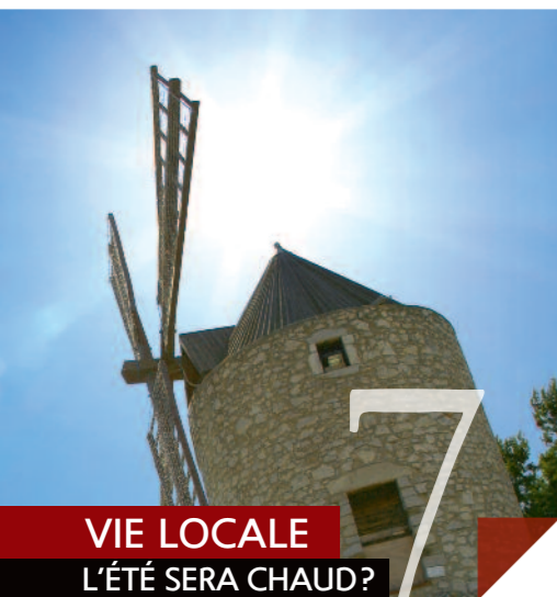
VIE LOCALE L'ÉTÉ SERA CHAUD?