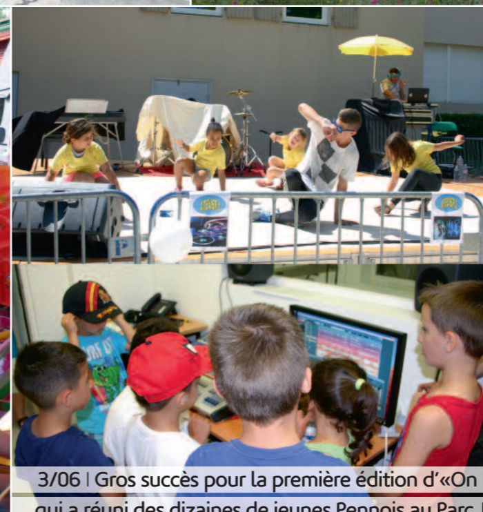
3/06 | Gros succès pour la première édition d'«On bouge ensemble» qui a réuni des dizaines de jeunes Pennois au Parc Jean Giono