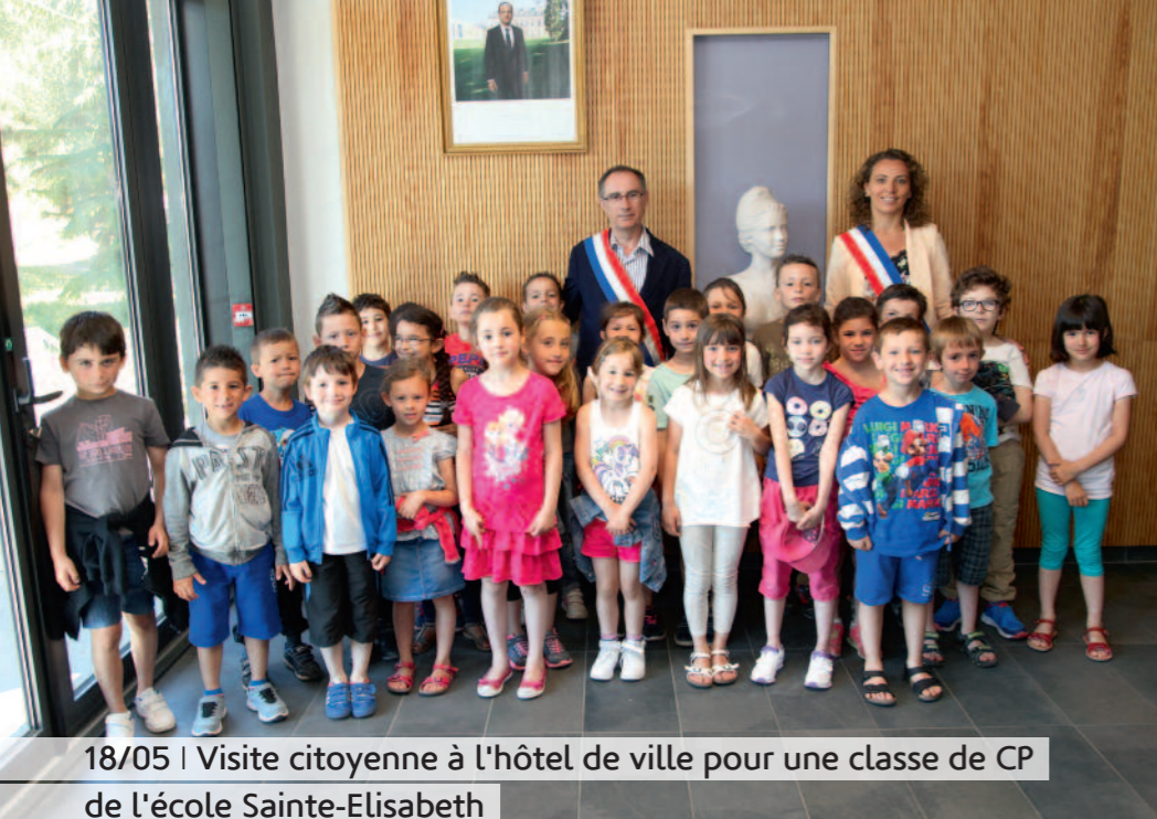
18/05 | Visite citoyenne à l'hôtel de ville pour une classe de CP de l'école Sainte-Elisabeth