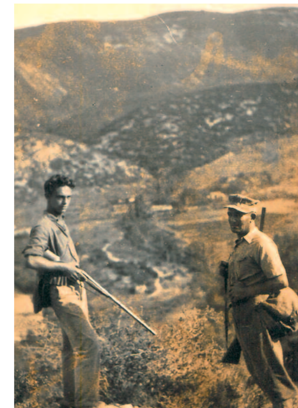
Des chasseurs, sur les hauteurs de Plan de Campagne