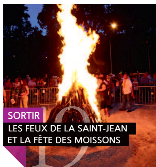
SORTIR LES FEUX DE LA SAINT-JEAN ET LA FÊTE DES MOISSONS