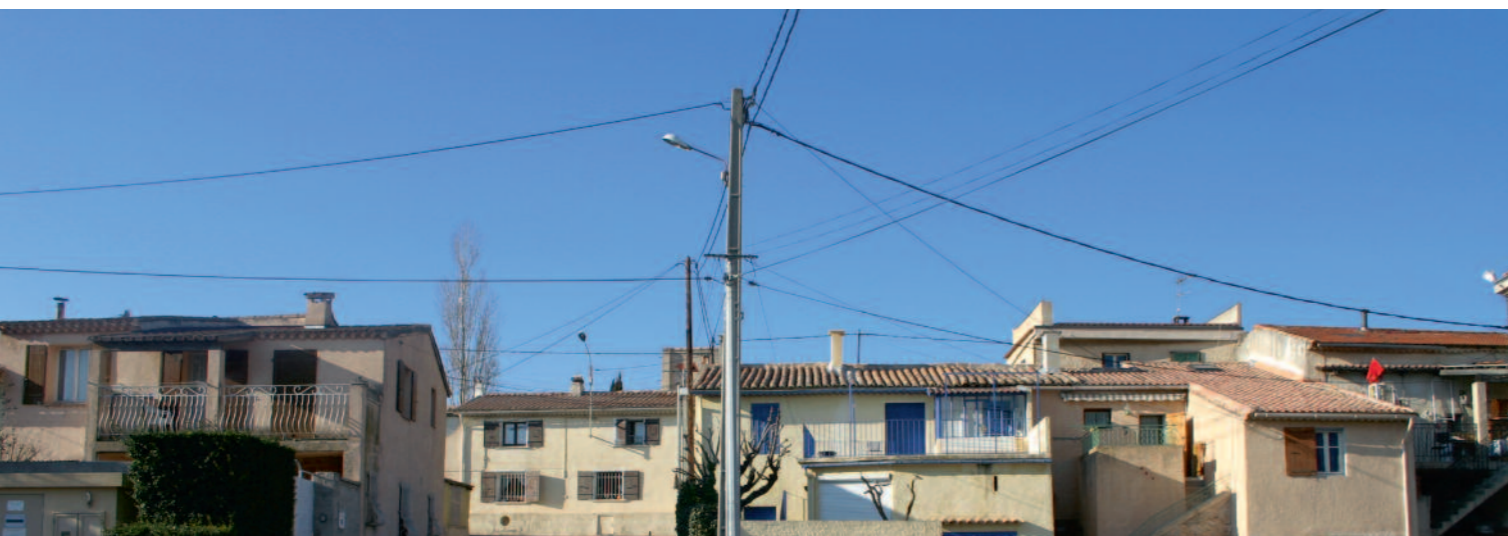
Le hameau de Plan de Campagne a conservé son cachet d'antan

car ici on cultive tout ce qui peut pousser sur des terrains ensoleillés : ail, melons, lentilles, pois chiches... Des produits qui sont ensuite livrés jusqu'à Marseille en charrette.