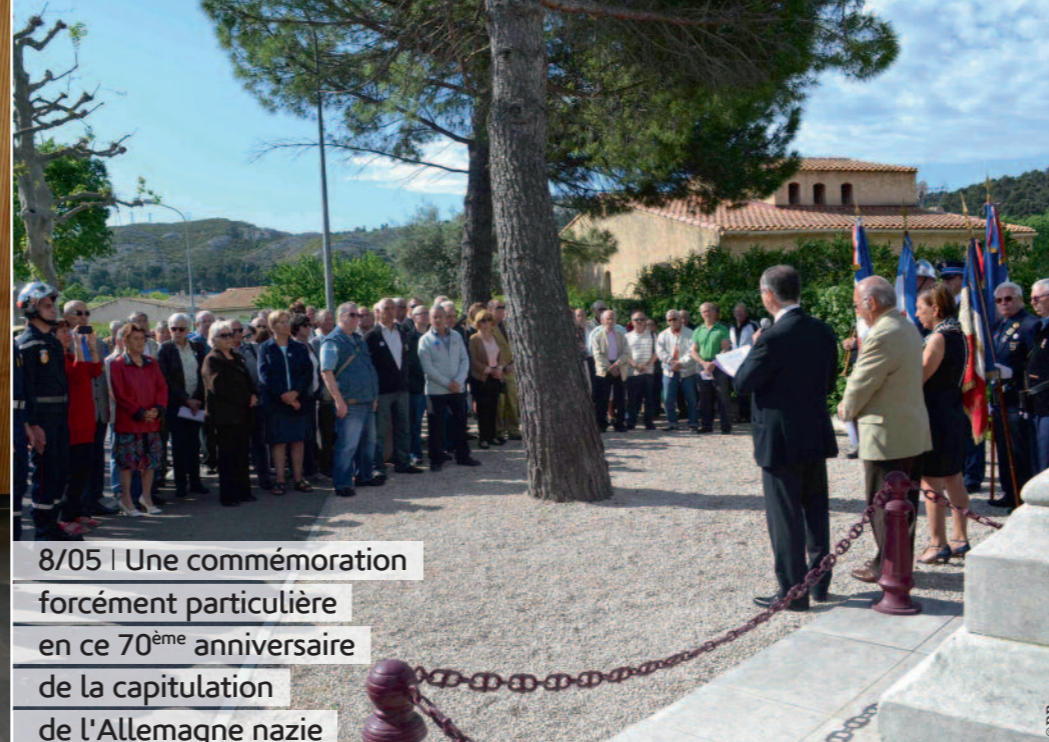
8/05 | Une commémoration forcément particulière en ce 70 ème anniversaire de la capitulation de l'Allemagne nazie