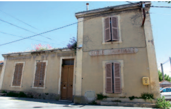
Le bâtiment de l'école communale, encore visible