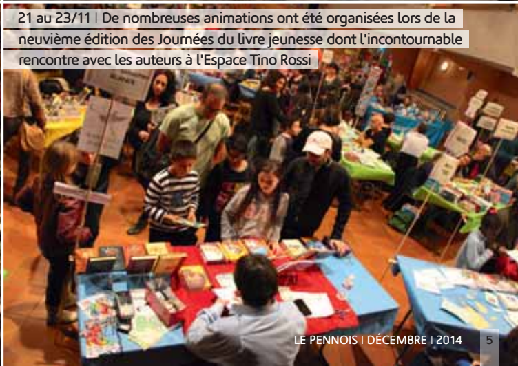
21 au 23/11 | De nombreuses animations ont été organisées lors de la neuvième édition des Journées du livre jeunesse dont l'incontournable rencontre avec les auteurs à l'Espace Tino Rossi