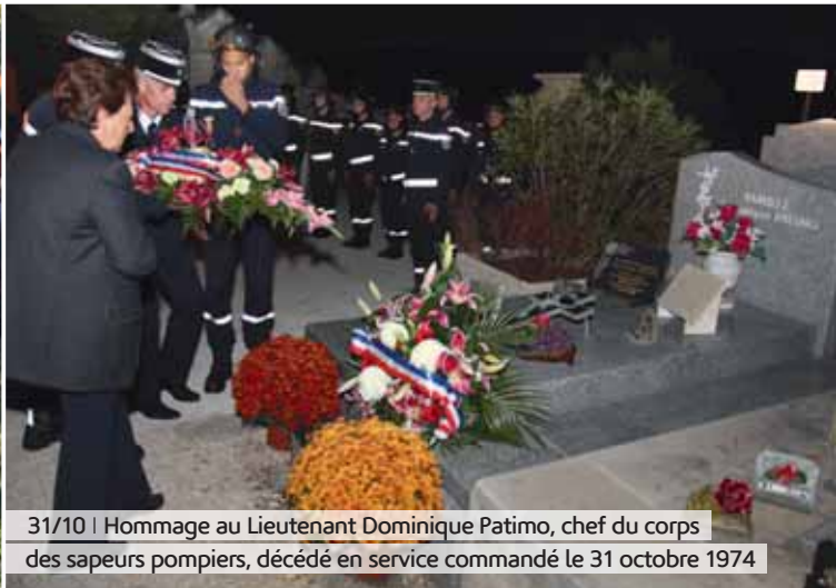
31/10 | Hommage au Lieutenant Dominique Patimo, chef du corps des sapeurs pompiers, décédé en service commandé le 31 octobre 1974