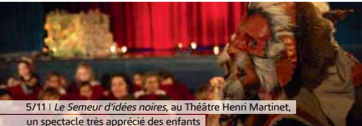
5/11 | Le Semeur d'idées noires , au Théâtre Henri Martinet, un spectacle très apprécié des enfants