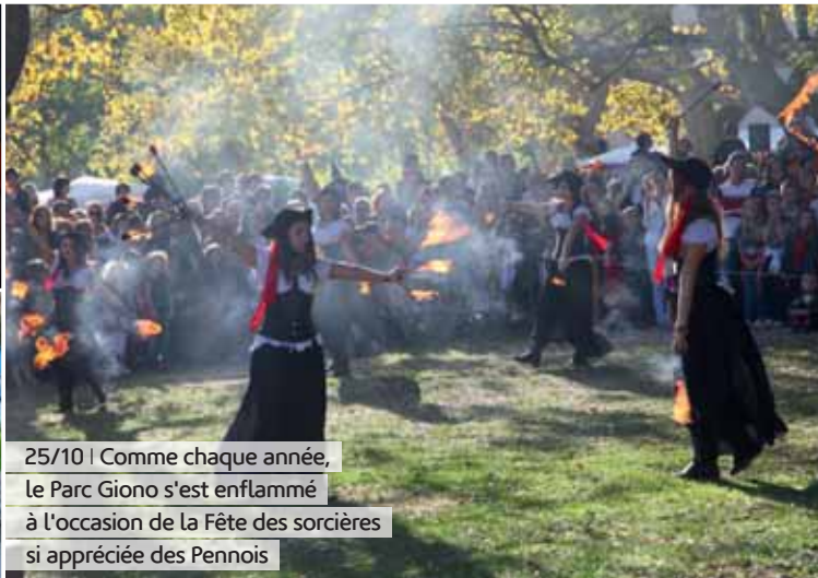
25/10 | Comme chaque année, le Parc Giono s'est enflammé à l'occasion de la Fête des sorcières si appréciée des Pennois