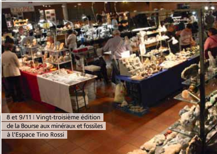
8 et 9/11 | Vingt-troisième édition de la Bourse aux minéraux et fossiles à l'Espace Tino Rossi