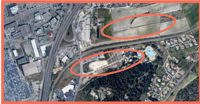
Les deux sites envisagés pour l'implantation de la future gare de Plan-de-Campagne.

Dans le cadre de la modernisation de la ligne Marseille-Aix, il est envisagé la création d'une gare à Plan-de-Campagne. Venez vous informer et en discuter lors de la réunion publique du 15 décembre à 18h30 à l'Hôtel de Ville.