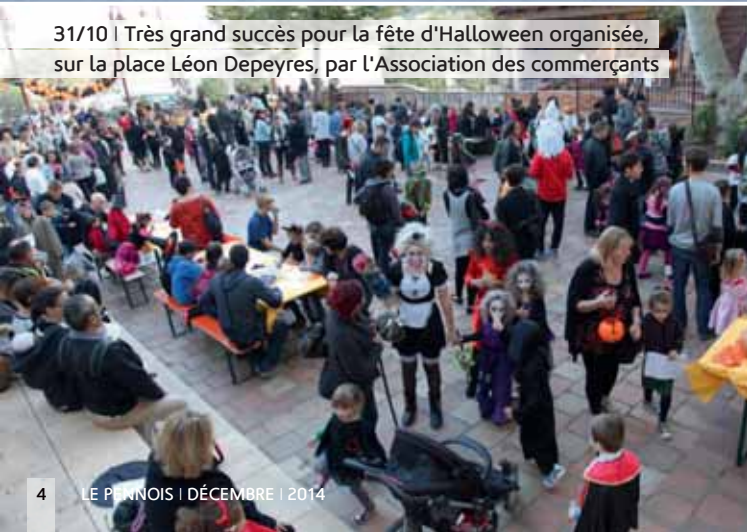
31/10 | Très grand succès pour la fête d'Halloween organisée, sur la place Léon Depeyres, par l'Association des commerçants