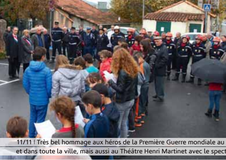
11/11 | Très bel hommage aux héros de la Première Guerre mondiale au square Malausse et dans toute la ville, mais aussi au Théâtre Henri Martinet avec le spectacle Poilu show