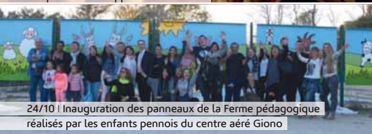
24/10 | Inauguration des panneaux de la Ferme pédagogique réalisés par les enfants pennois du centre aéré Giono