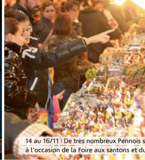
14 au 16/11 | De très nombreux Pennois se sont rendus en famille à l'Espace Tino Rossi, à l'occasion de la Foire aux santons et du Marché de Noël