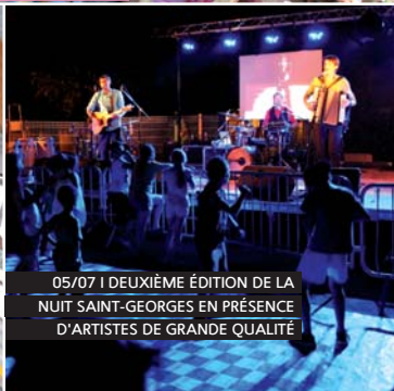
05/07 | DEUXIÈME ÉDITION DE LA NUIT SAINT-GEORGES EN PRÉSENCE D'ARTISTES DE GRANDE QUALITÉ