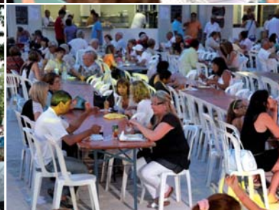
JUILLET/AOÛT | LA DEUXIÈME ÉDITION DES FESTIPENNOISES A ATTIRÉ UN TRÈS NOMBREUX PUBLIC FAMILIAL