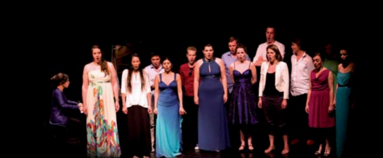
25/06 | QUAND LE TRÈS RENOMMÉ FESTIVAL INTERNATIONAL D'ART LYRIQUE D'AIX-EN-PROVENCE FAIT UN DÉTOUR PAR LE THÉÂTRE HENRI MARTINET