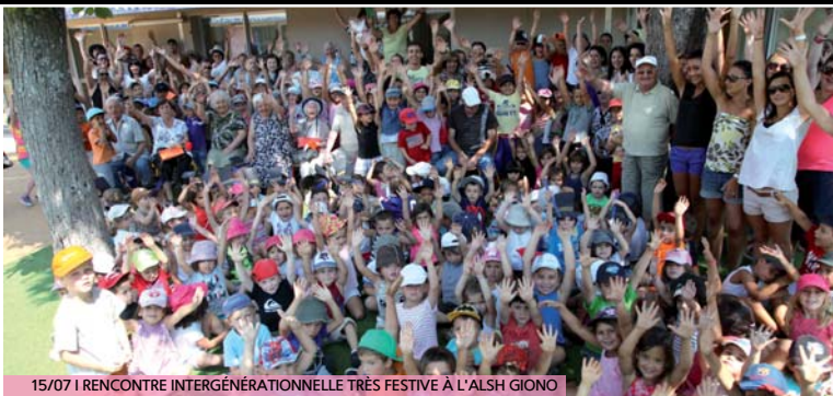
15/07 | RENCONTRE INTERGÉNÉRATIONNELLE TRÈS FESTIVE À L'ALSH GIONO