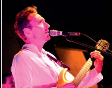
21/06 | PEP'S, INVITÉ D'HONNEUR DE LA FÊTE DE LA MUSIQUE QUI S'EST DÉROULÉE SUR LA PLACE FÉLIX AUREILLE AUX CADENEAUX