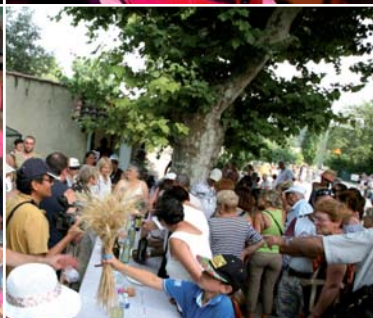
29/06 | ENCORE BEAUCOUP DE MONDE POUR L'ÉDITION 2013 DE LA FÊTE DES MOISSONS