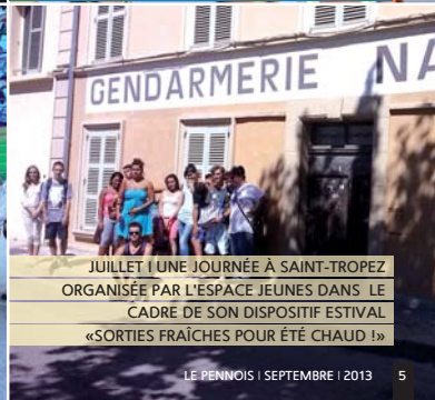
JUILLET | UNE JOURNÉE À SAINT-TROPEZ ORGANISÉE PAR L'ESPACE JEUNES DANS LE CADRE DE SON DISPOSITIF FESTIVAL «SORTIES FRAÎCHES POUR ÉTÉ CHAUD !»