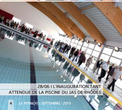
28/06 | L'INAUGURATION TANT ATTENDUE DE LA PISCINE DU JAS DE RHODÉS