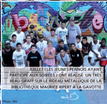
JUILLET | LES JEUNES PENNOIS AYANT PARTICIPÉ AUX SOIRÉES J'ONT RÉALISÉ UN TRÈS BEAU GRAFF SUR LE RIDEAU MÉTALLIQUE DE LA BIBLIOTHÈQUE MAURICE RIPERT À LA GAVOTTE