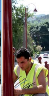
L'éclairage de l'ensemble du chemin de la Ferme a été renové : enfouissement des réseaux télécoms, ERDF et remplacement des poteaux bétons par de nouveaux candélabres identiques à ceux du village des Pennes.