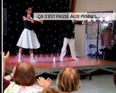
ÇA S'EST PASSÉ AUX PENNES...