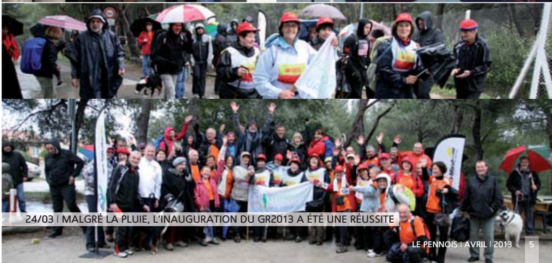
24/03 | MALGRÉ LA PLUIE, L'INAUGURATION DU GR2013 A ÉTÉ UNE RÉUSSITE