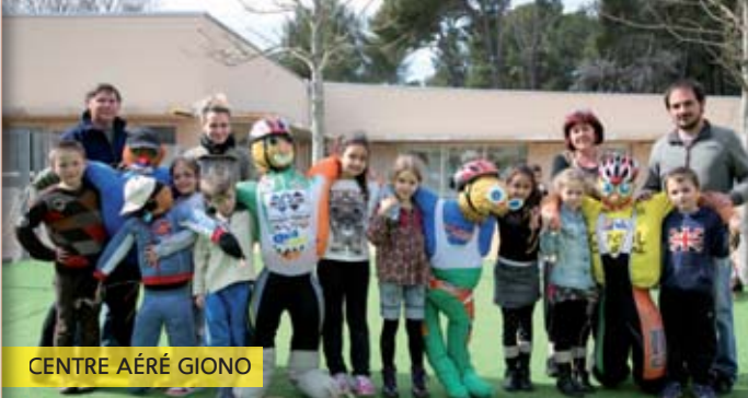
CENTRE AÉRÉ GIONO

La fée du bien-être, 60 avenue Etienne Rabattu, tél. 06 03 59 38 38