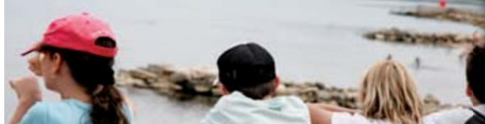
COLONIES DE VACANCES

Cette année, la commémoration du génocide arménien aura lieu samedi 27 avril, à 11h. Elle se déroulera, naturellement, devant le monument aux morts du rond-point du 24 avril 1915, sur la RD6 qui mène à Plan-de-Campagne. Le lendemain, nouvel hommage. En effet, traditionnellement, le dernier dimanche d'avril est dédié à la «Journée nationale du souvenir des victimes et des héros de la déportation». Cette commémoration se tiendra, comme d'habitude, au square Jean Moulin à partir de 9h30.