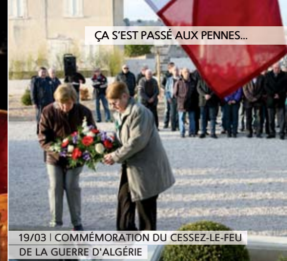
ÇA S'EST PASSÉ AUX PENNES...