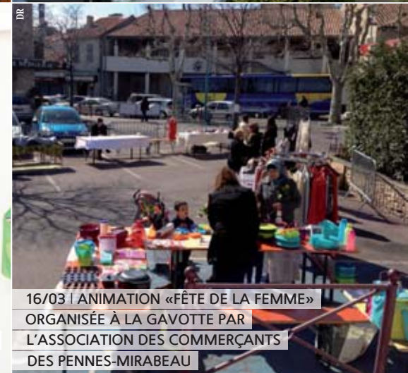
16/03 | ANIMATION «FÊTE DE LA FEMME» ORGANISÉE À LA GAVOTTE PAR L'ASSOCIATION DES COMMERÇANTS DES PENNES-MIRABEAU