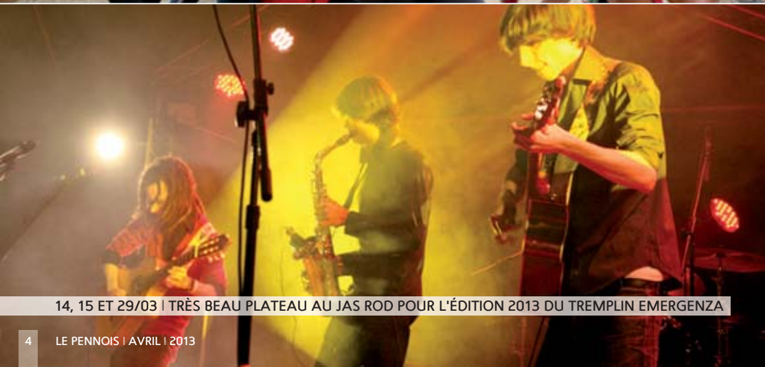
14, 15 ET 29/03 | TRÈS BEAU PLATEAU AU JAS ROD POUR L'ÉDITION 2013 DU TREMPIN EMERGENZA