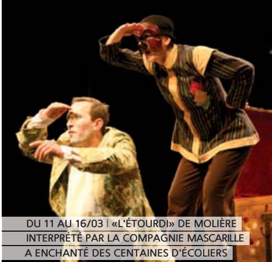
DU 11 AU 16/03 | «L'ÉTOURDI» DE MOLIÈRE INTERPRÉTÉ PAR LA COMPAGNIE MASCARILLE A ENCHANTÉ DES CENTAINES D'ÉCOLIERS