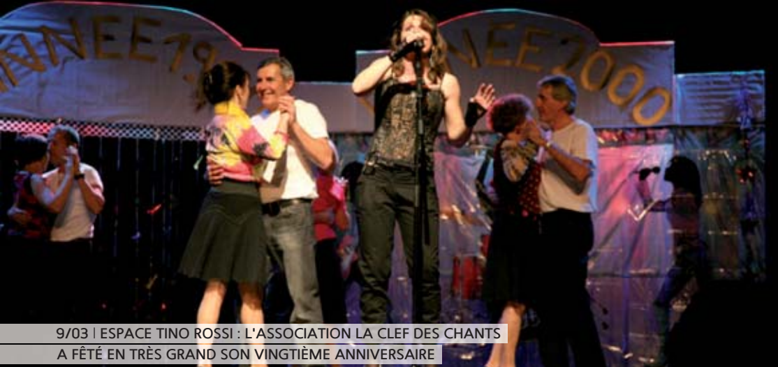
9/03 | ESPACE TINO ROSSI : L'ASSOCIATION LA CLEF DES CHANTS A FÊTÉ EN TRÈS GRAND SON VINGTIÈME ANNIVERSAIRE