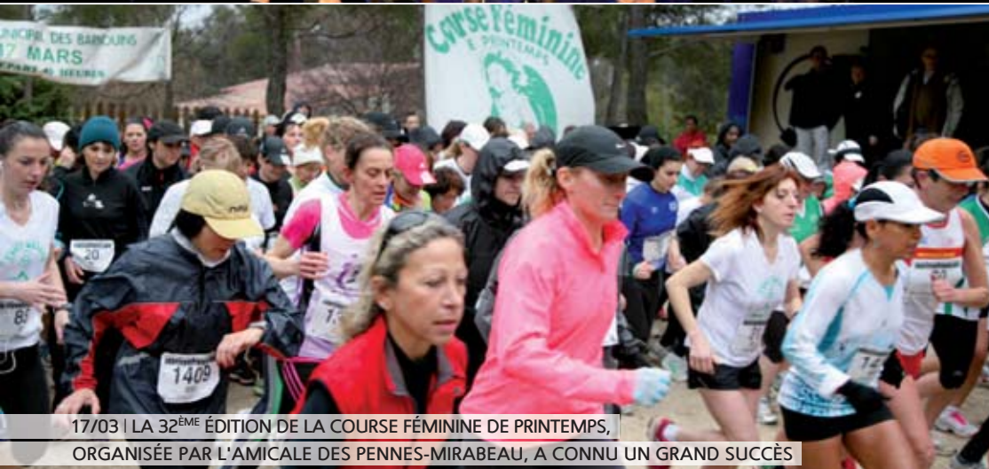
17/03 | LA 32ÈME ÉDITION DE LA COURSE FÉMININE DE PRINTEMPS, ORGANISÉE PAR L'AMICALE DES PENNES-MIRABEAU, A CONNU UN GRAND SUCCÈS