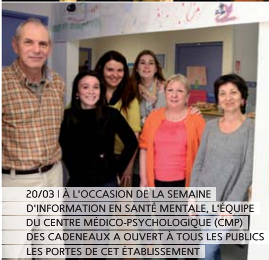
20/03 | À L'OCCASION DE LA SEMAINE D'INFORMATION EN SANTÉ MENTALE, L'ÉQUIPE DU CENTRE MÉDICO-PSYCHOLOGIQUE (CMP) DES CADENEAUX A OUVERT À TOUS LES PUBLICS LES PORTES DE CET ÉTABLISSEMENT