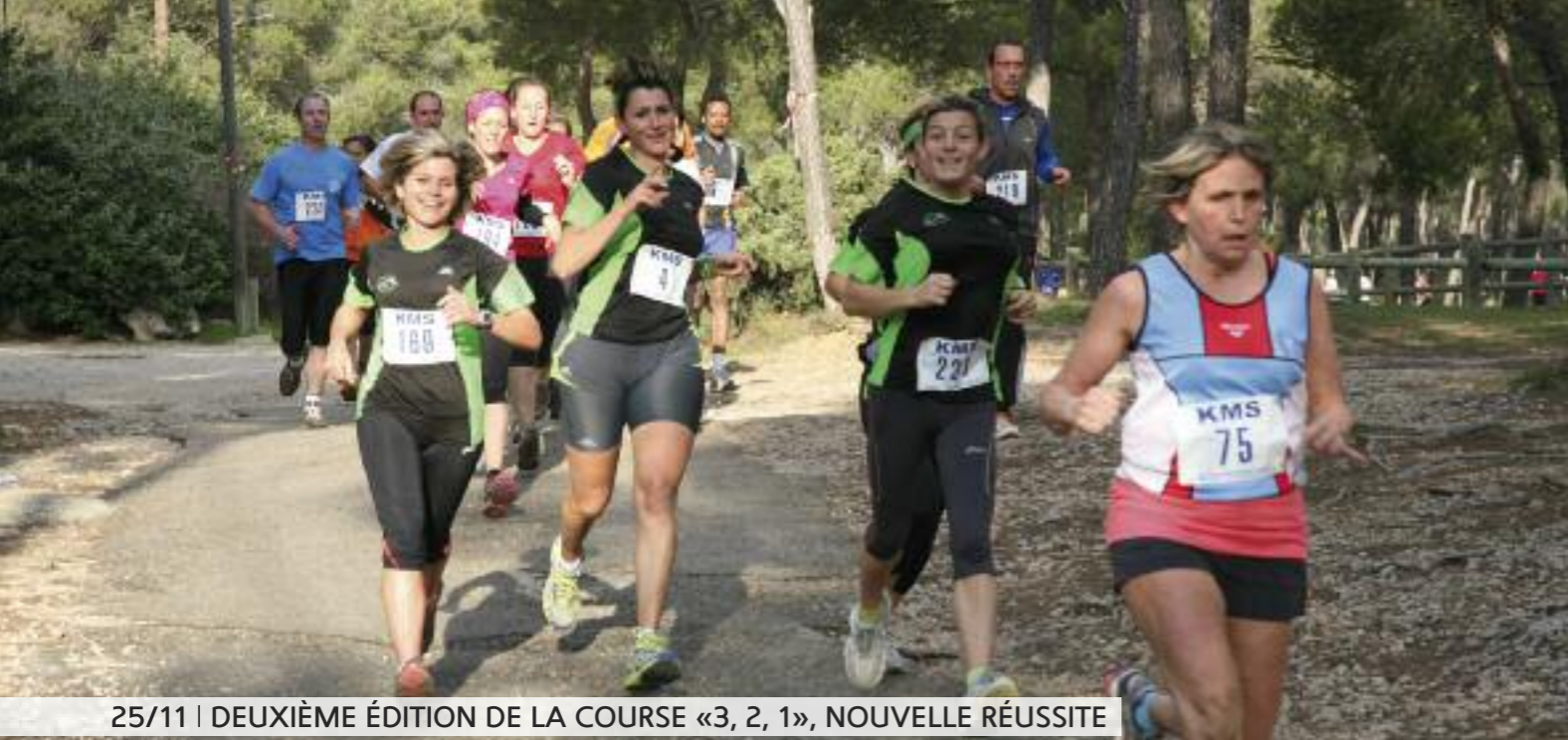
25/11 | DEUXIÈME ÉDITION DE LA COURSE «3, 2, 1», NOUVELLE RÉUSSITE