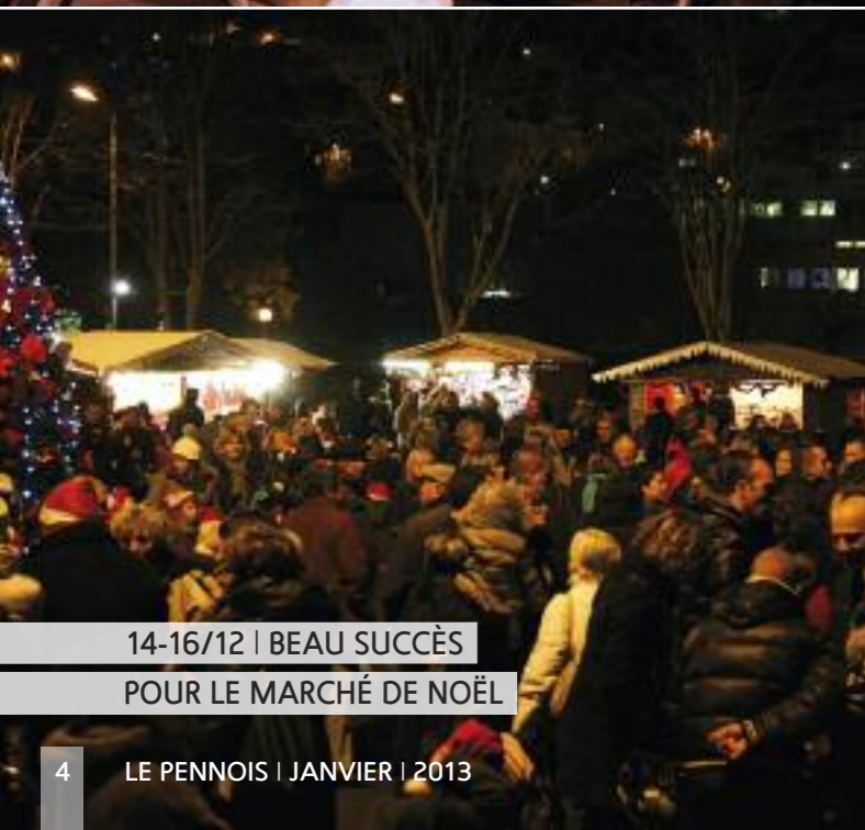
14-16/12 | BEAU SUCCÈS POUR LE MARCHÉ DE NOËL