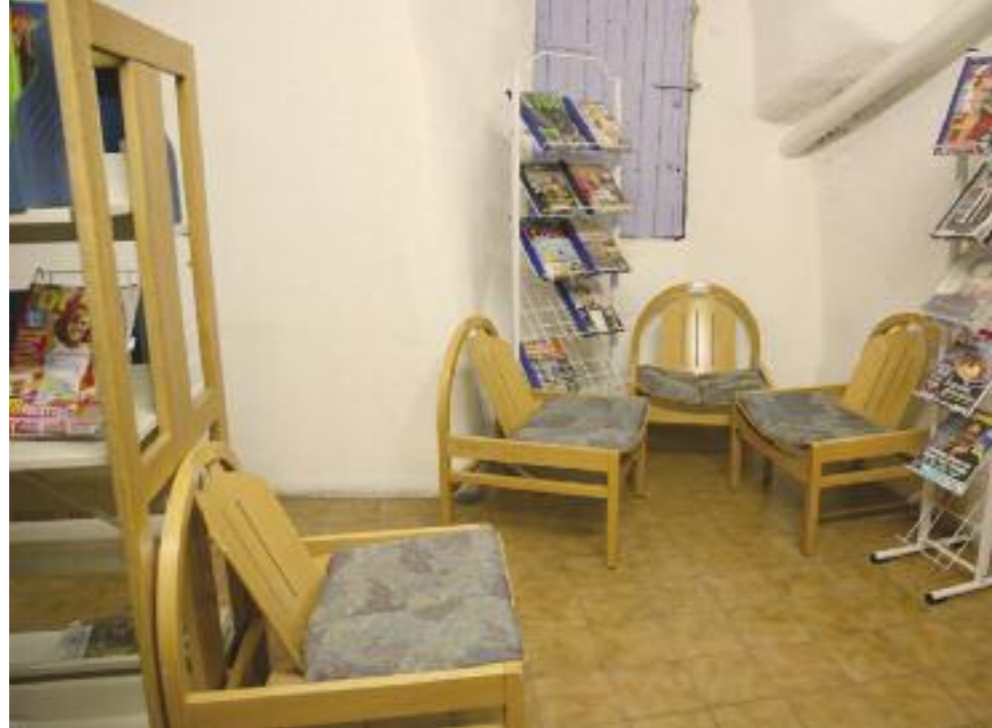
La médiathèque dans ses nouveaux locaux du château de Vento