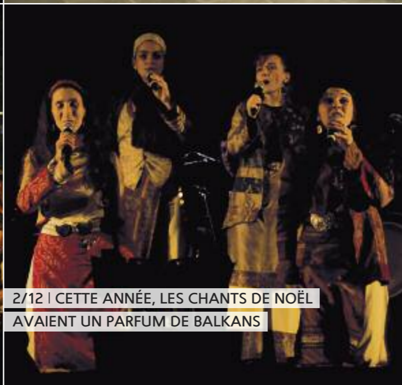
2/12 | CETTE ANNÉE, LES CHANTS DE NOËL AVAIENT UN PARFUM DE BALKANS