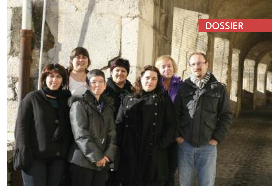
L'équipe des agents des bibliothèques