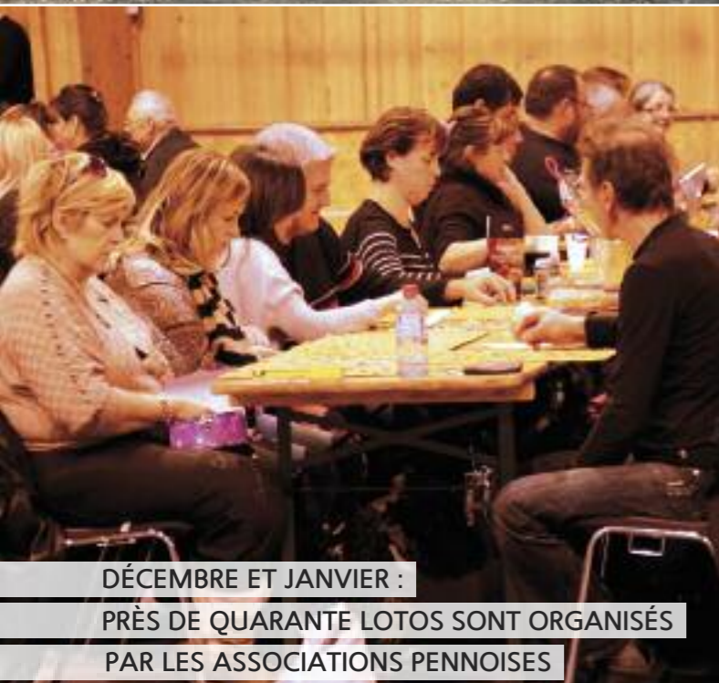
DÉCEMBRE ET JANVIER : PRÈS DE QUARANTE LOTOS SONT ORGANISÉS PAR LES ASSOCIATIONS PENNOISES