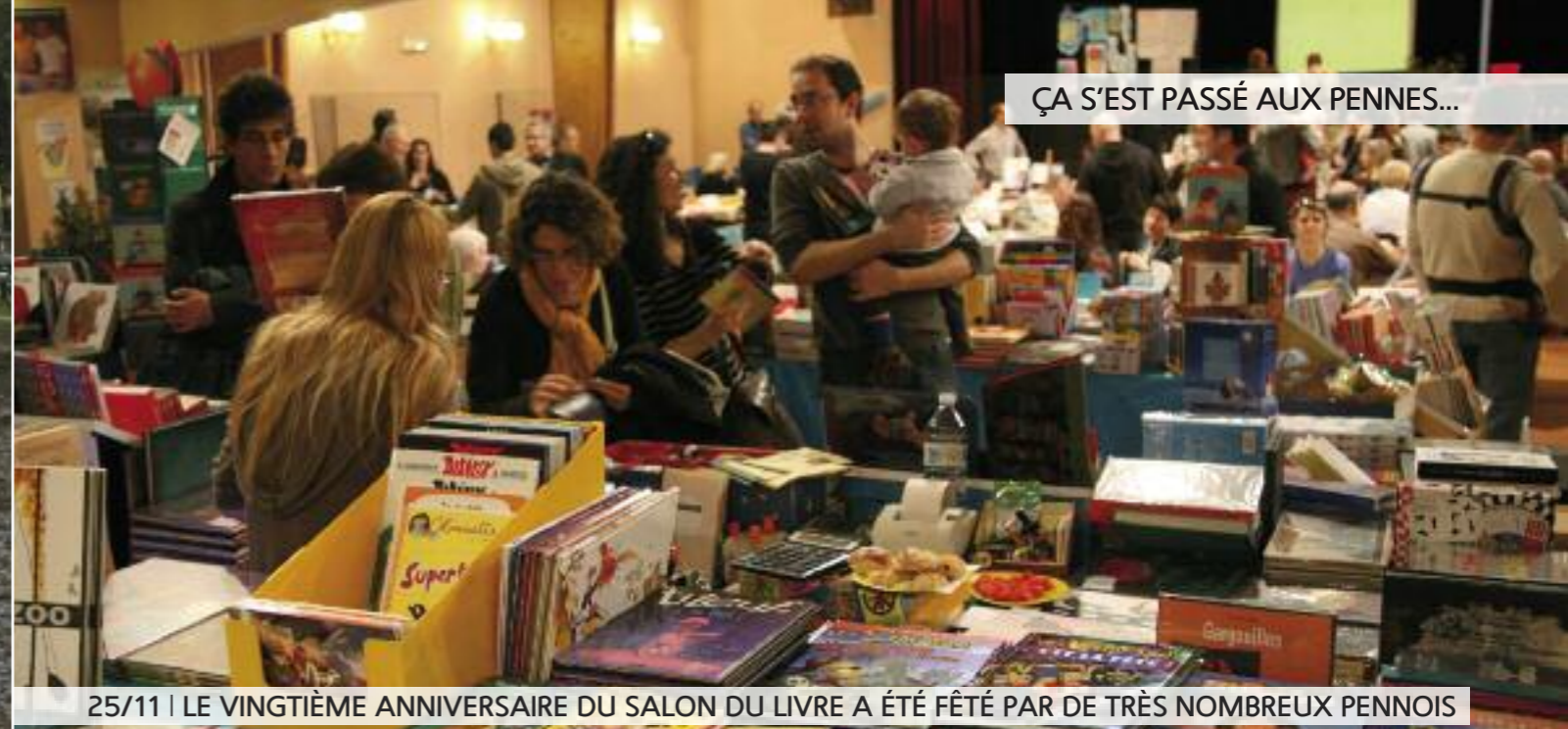
ÇA S'EST PASSÉ AUX PENNES...