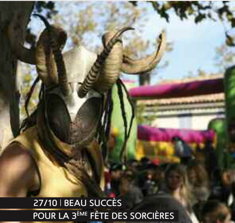
27/10 | BEAU SUCCÈS POUR LA 3 ÈME FÊTE DES SORCIÈRES