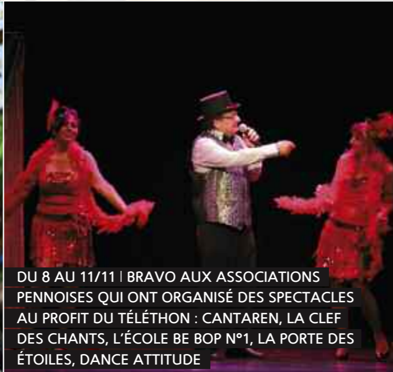
DU 8 AU 11/11 | BRAVO AUX ASSOCIATIONS PENNOISES QUI ONT ORGANISÉ DES SPECTACLES AU PROFIT DU TÉLÉTHON : CANTAREN, LA CLEF DES CHANTS, L'ÉCOLE BE BOP N°1, LA PORTE DES ÉTOILES, DANCE ATTITUDE