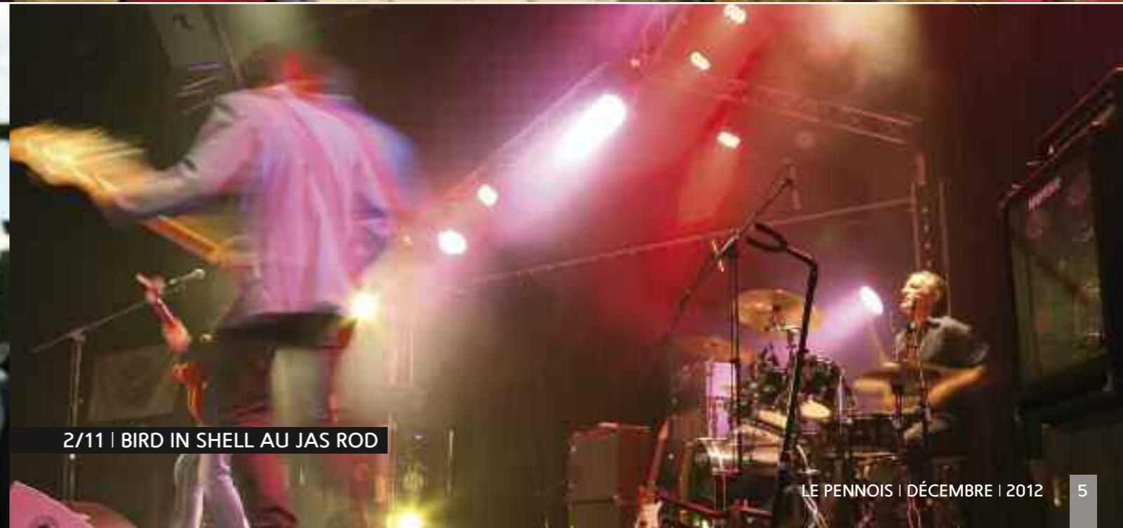
2/11 | BIRD IN SHELL AU JAS ROD