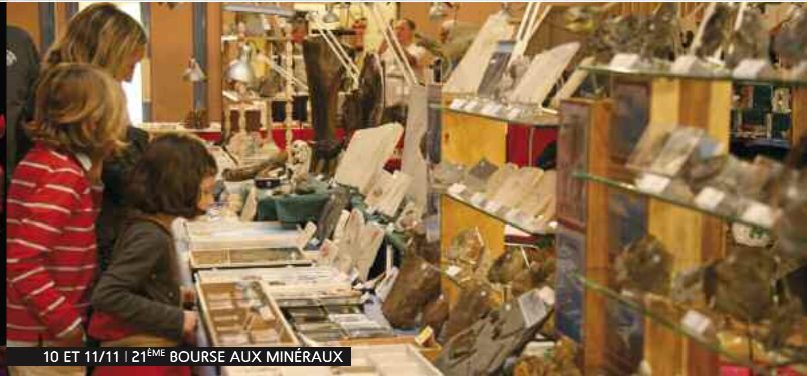
10 ET 11/11 | 21 ÈME BOURSE AUX MINÉRAUX