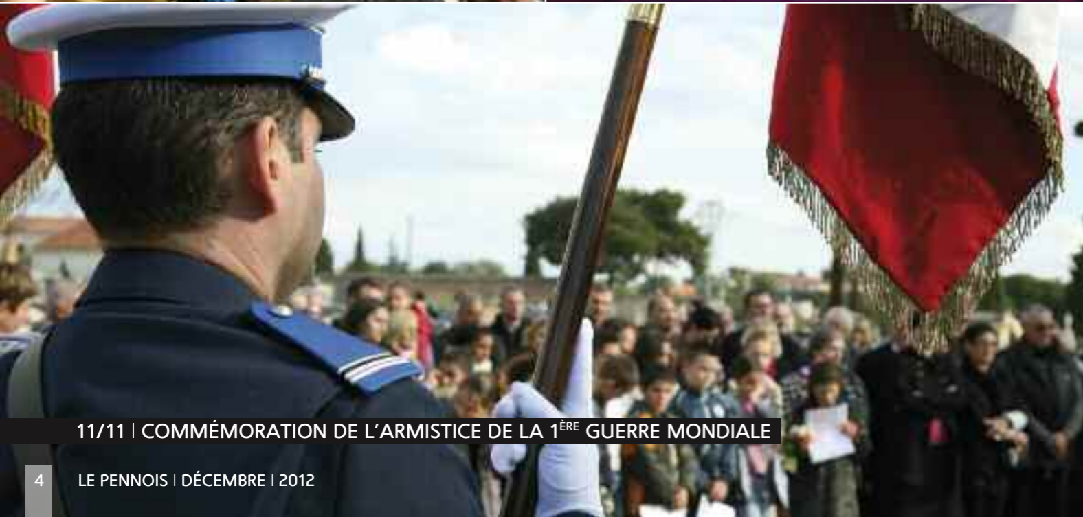
11/11 | COMMÉMORATION DE L'ARMISTICE DE LA 1 ÈRE GUERRE MONDIALE