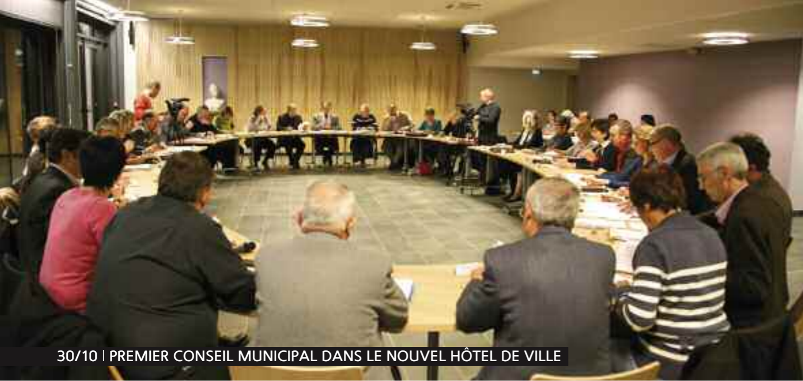
30/10 | PREMIER CONSEIL MUNICIPAL DANS LE NOUVEL HÔTEL DE VILLE