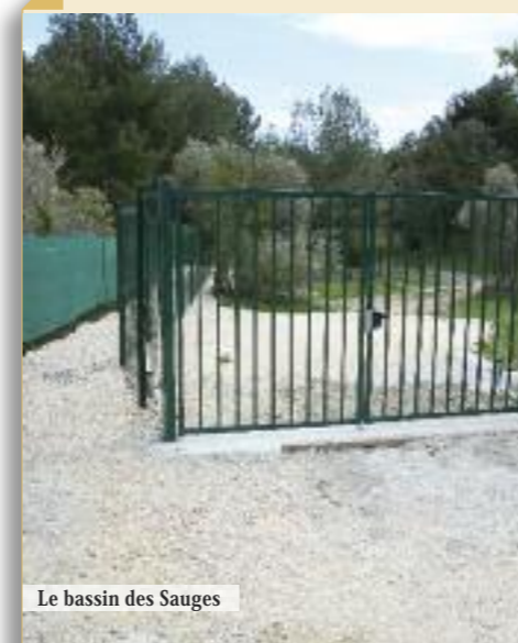
Le bassin des Sauges

aura pour principal objectif de réduire le débit provenant du Parc Saint-Georges. Parallèlement, toujours en 2013, deux autres études seront lancées suivies de travaux concernant les bassins Bellepeire et Giono. En effet, près du cimetière, les inondations sont fréquentes car le bassin qui avait été réalisé par le passé, en même temps que les constructions environnantes, se révèle insuffisant. Le nouveau bassin aura un volume de 3 000 m 3 et les collecteurs situés le long du cimetière seront revus et recalibrés. Tout comme celui des Cardelines, il sera à ciel ouvert d'autant qu'il se situera en pleine nature. Même chose pour le bassin Giono qui aura une capacité impressionnante de 7 800 m 3 , remplaçant l'actuel qui, compte tenu de sa configuration, a très peu d'utilité. Ces travaux s'achèveront en 2014 et marqueront la fin d'un long feuilleton forcément gagnant pour la ville et ses habitants.