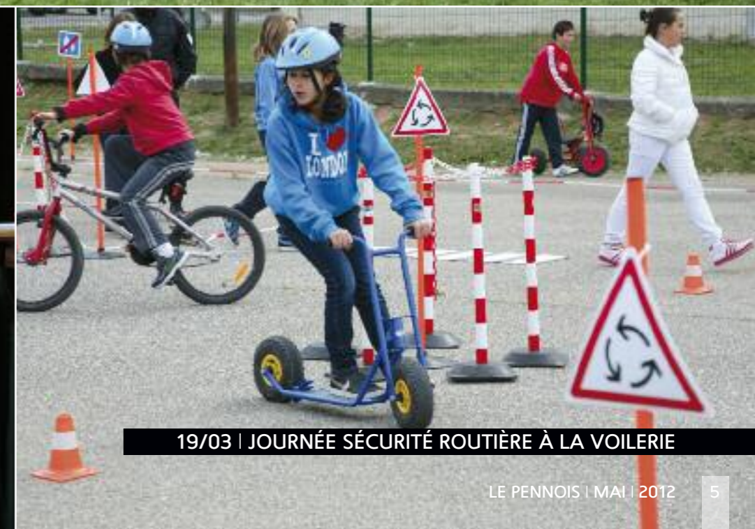
19/03 | JOURNÉE SÉCURITÉ ROUTIÈRE À LA VOILERIE