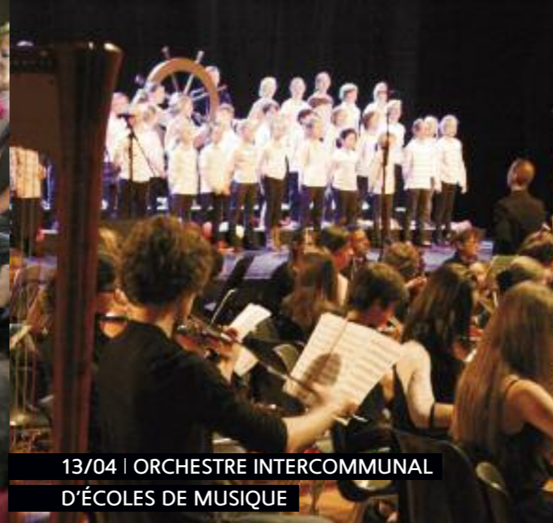
13/04 | ORCHESTRE INTERCOMMUNAL D'ÉCOLES DE MUSIQUE