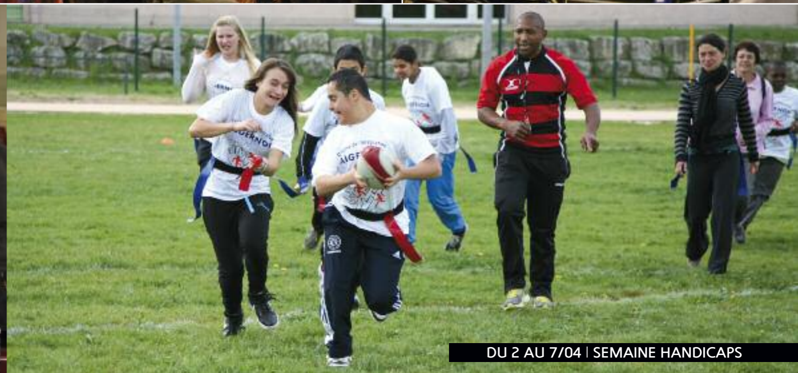
DU 2 AU 7/04 | SEMAINE HANDICAPS