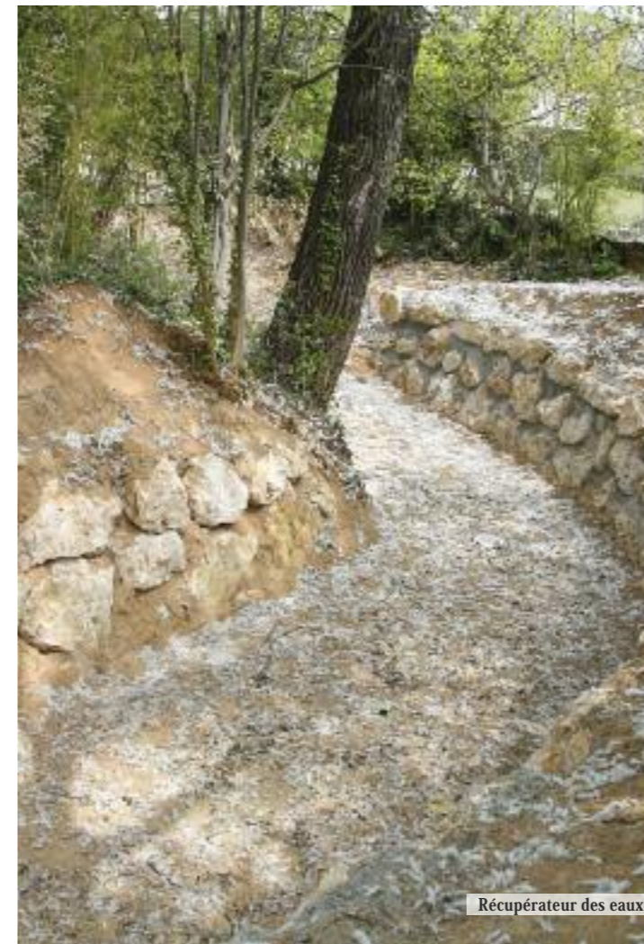
Récupérateur des eaux pluviales des Pinchinades

Toutes ces questions administratives étant désormais réglées, les chantiers se multiplient un petit peu partout dans la ville. En 2011, pas moins de douze opérations ont été menées, parmi lesquelles le nouveau bassin des Cardelines, situé aux environs de la Cité-Haute en Provence. À ciel ouvert, il aura une capacité de 5 650 m 3 , répartis en deux compartiments. Ce chantier sera achevé avant l'été tout comme celui du bassin de rétention, proche de Gédimat sur la RN 113, qui lui sera simplement rénové et verra sa capacité