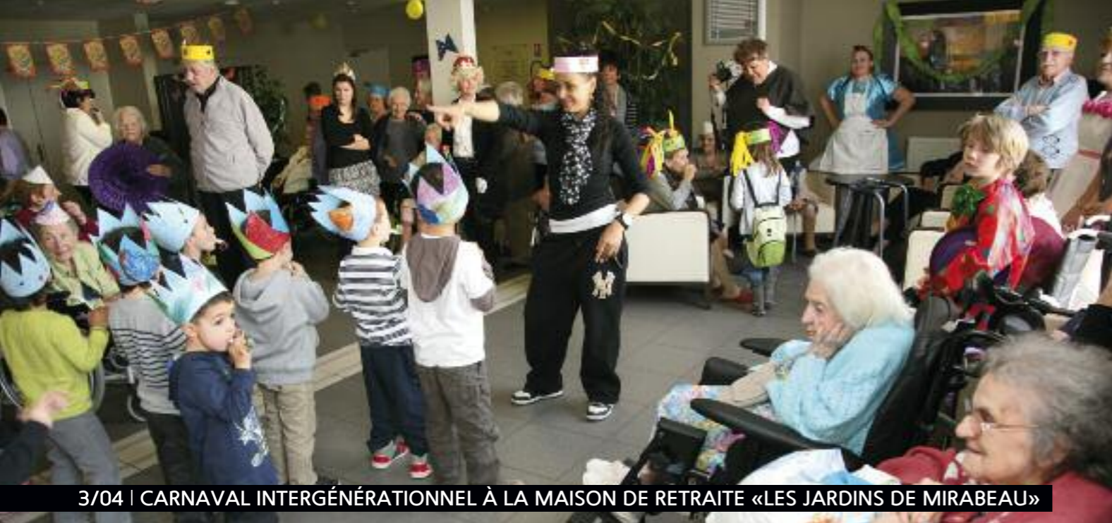
3/04 | CARNAVAL INTERGÉNÉRATIONNEL À LA MAISON DE RETRAITE «LES JARDINS DE MIRABEAU»