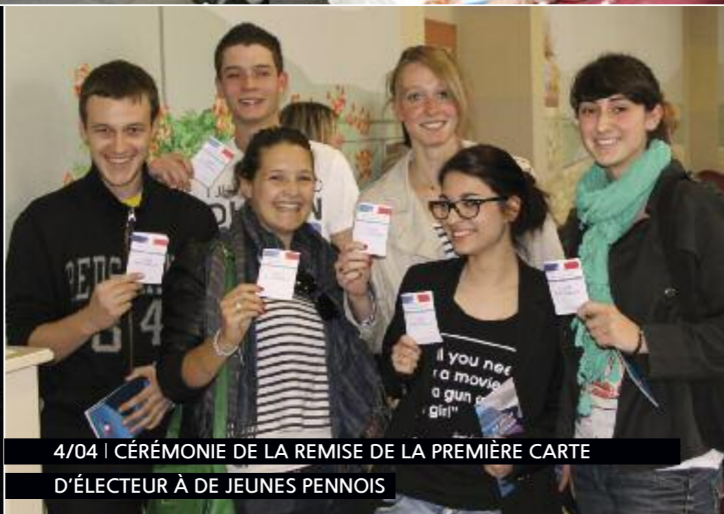
4/04 | CÉRÉMONIE DE LA REMISE DE LA PREMIÈRE CARTE D'ÉLECTEUR À DE JEUNES PENNOIS