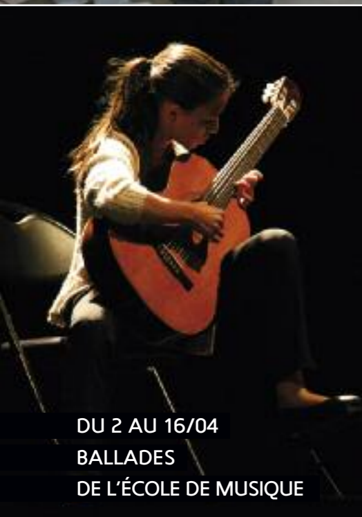
DU 2 AU 16/04 BALLADES DE L'ÉCOLE DE MUSIQUE