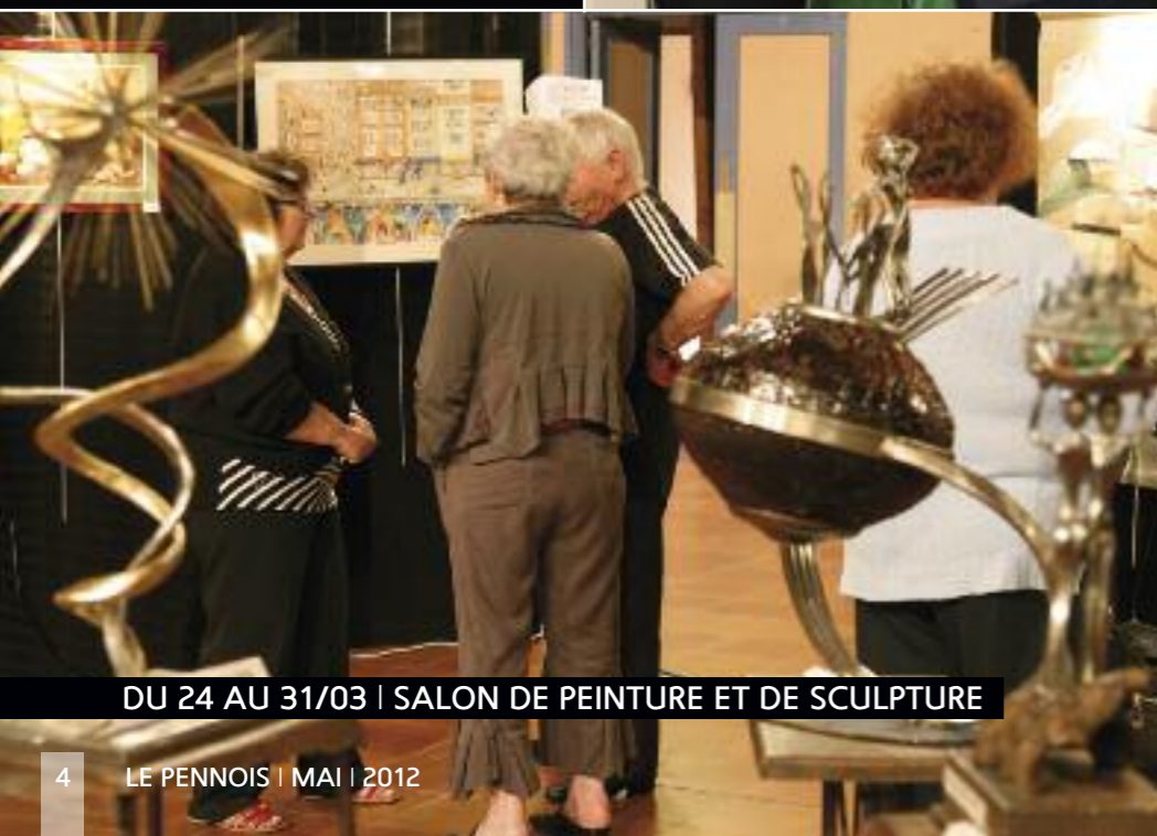
DU 24 AU 31/03 | SALON DE PEINTURE ET DE SCULPTURE