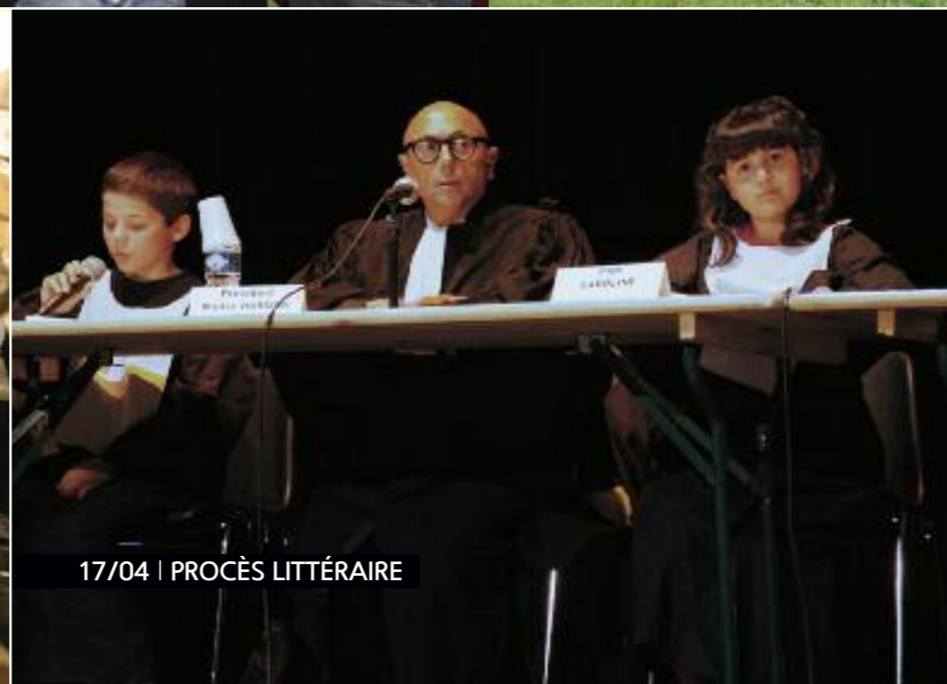
17/04 | PROCÈS LITTÉRAIRE