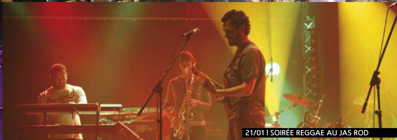
21/01 | SOIRÉE REGGAE AU JAS ROD