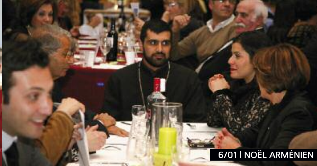
6/01 | NOËL ARMÉNIEN