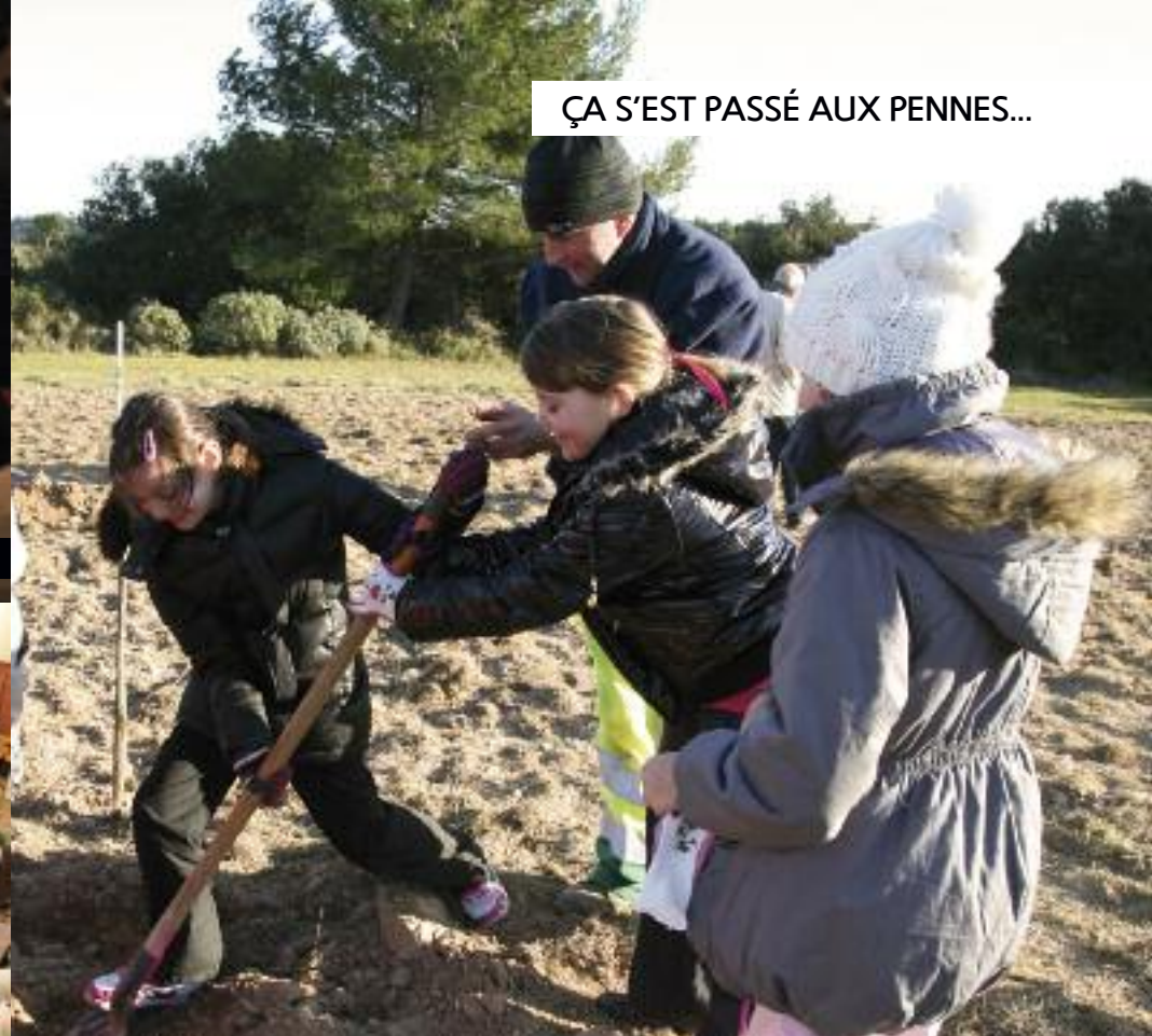
ÇA S'EST PASSÉ AUX PENNES...