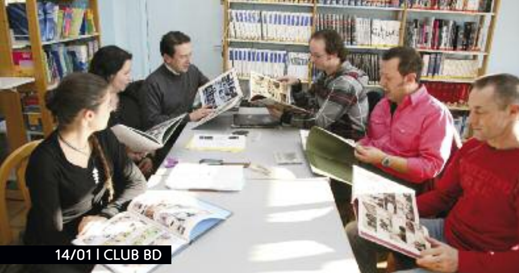
14/01 | CLUB BD