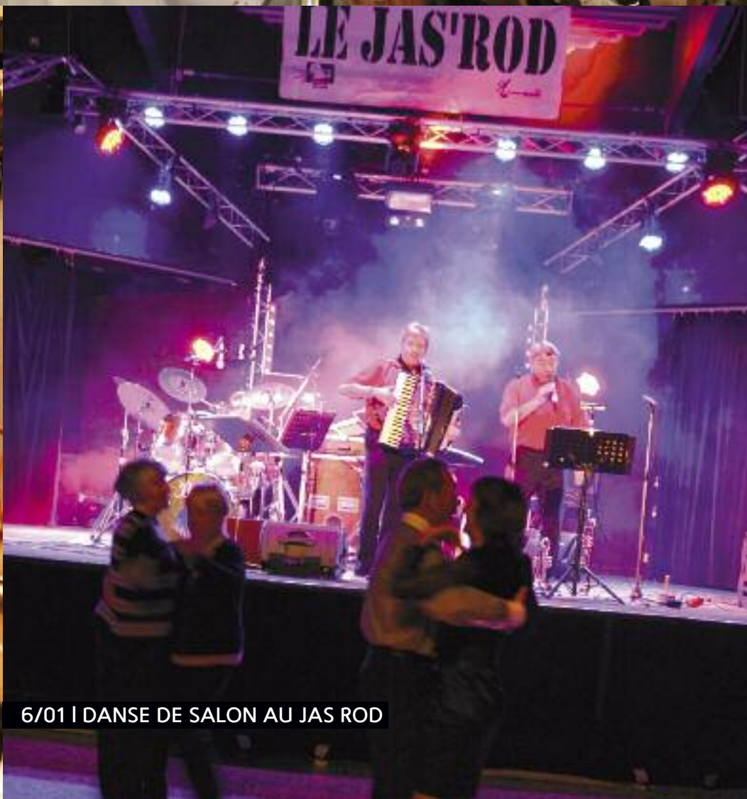
6/01 | DANSE DE SALON AU JAS ROD