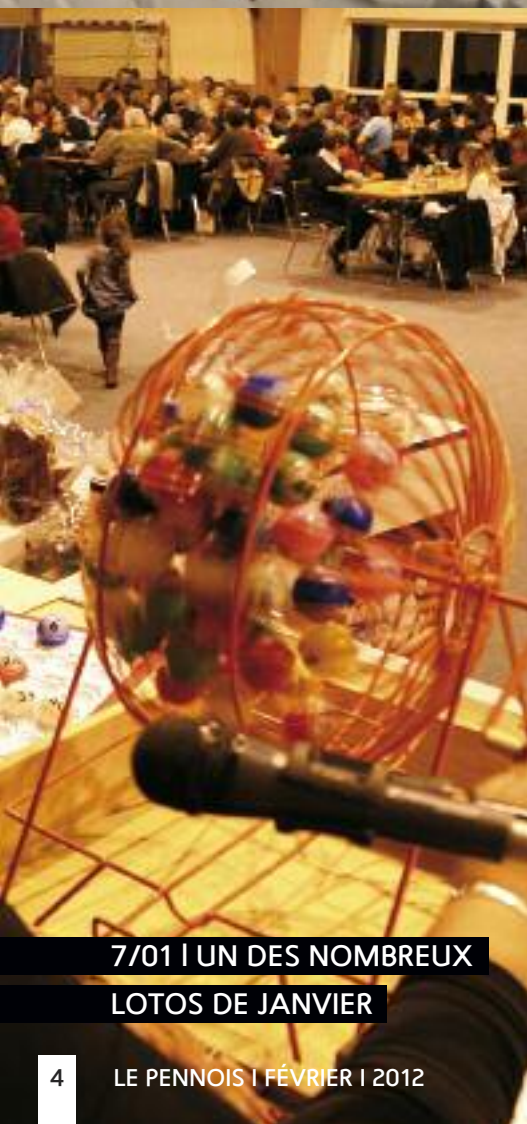
7/01 | UN DES NOMBREUX LOTOS DE JANVIER