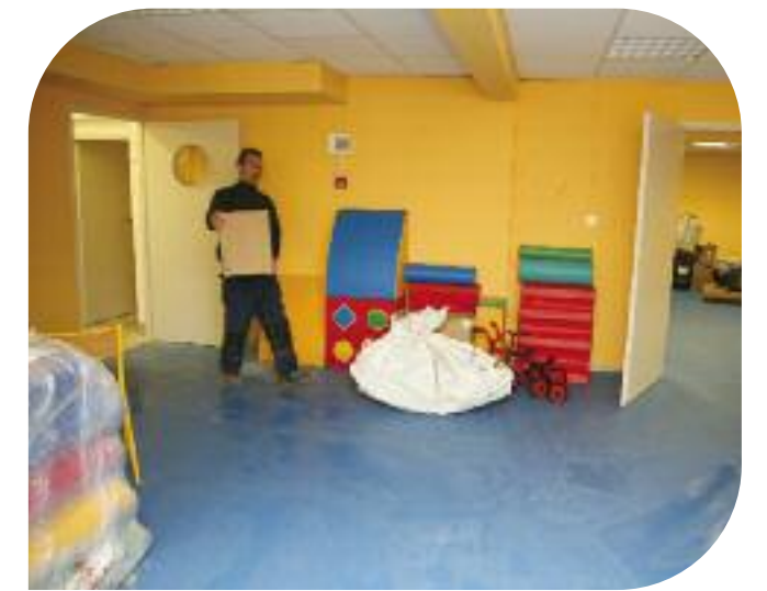
Derniers préparatifs avant l'ouverture (6 février)

Et pour que cette micro-crèche voit le jour, la commune a non seulement mis à disposition local, mobilier et matériel nécessaires à l'accueil des enfants, mais aussi une subvention annuelle de fonctionnement de 50 000 euros. En effet, cette nouvelle structure sera animée par une équipe de professionnels : trois CAP petite enfance, un agent d'entretien et de cuisine à temps partiel. L'association gestionnaire devra justifier l'accueil du public dans le respect des critères partagés avec la ville. Ainsi, priorité sera donc faite aux parents en démarche ou en insertion