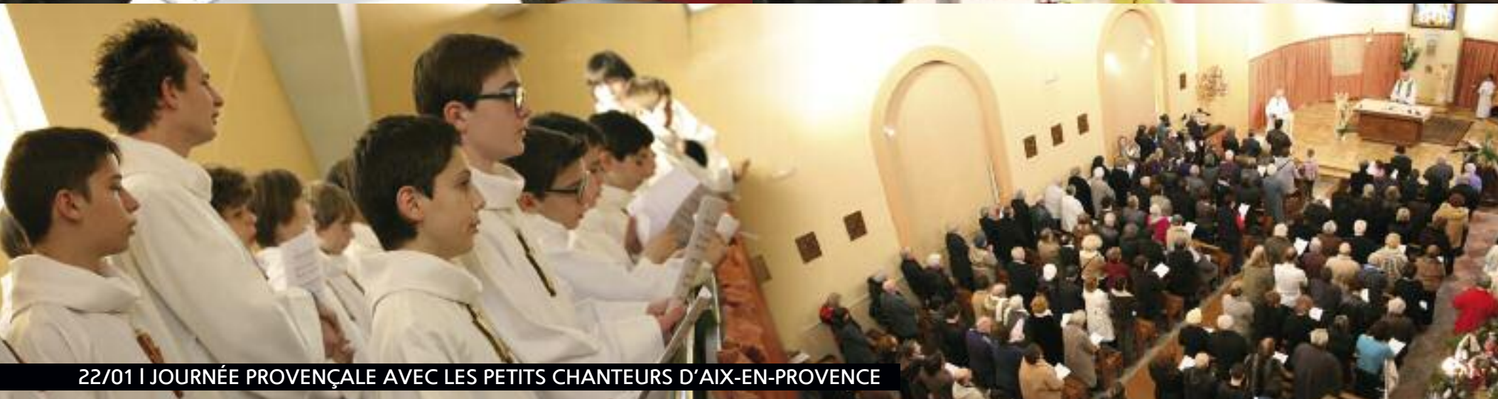
22/01 | JOURNÉE PROVENÇALE AVEC LES PETITS CHANTEURS D'AIX-EN-PROVENCE