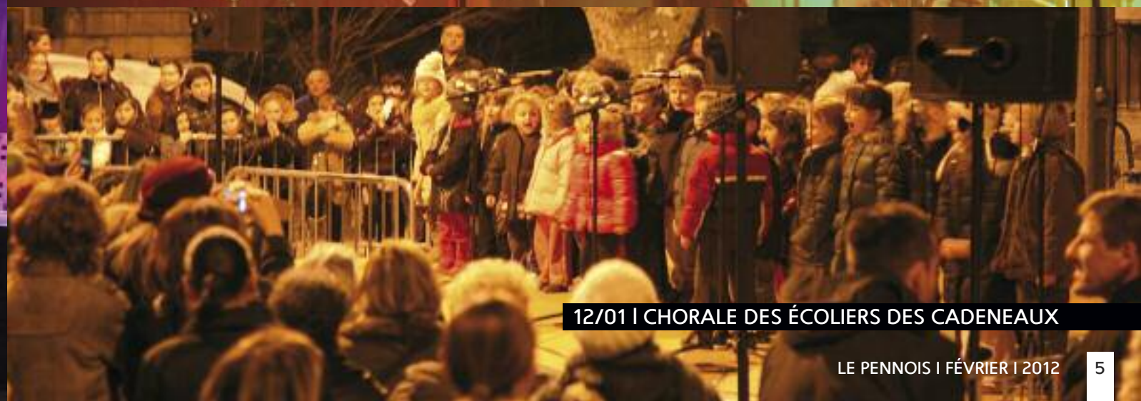
12/01 | CHORALE DES ÉCOLIERS DES CADENEAUX