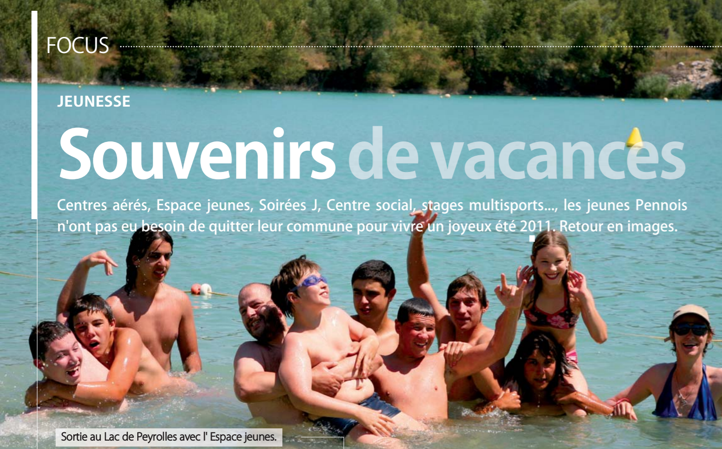
Sortie au Lac de Peyrolles avec l' Espace jeunes.

Centres aérés, Espace jeunes, Soirées J, Centre social, stages multisports..., les jeunes Pennois n'ont pas eu besoin de quitter leur commune pour vivre un joyeux été 2011. Retour en images.