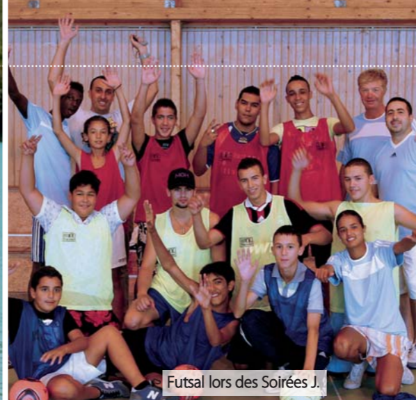
Futsal lors des Soirées J.