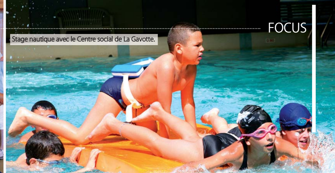
Stage nautique avec le Centre social de La Gavotte.