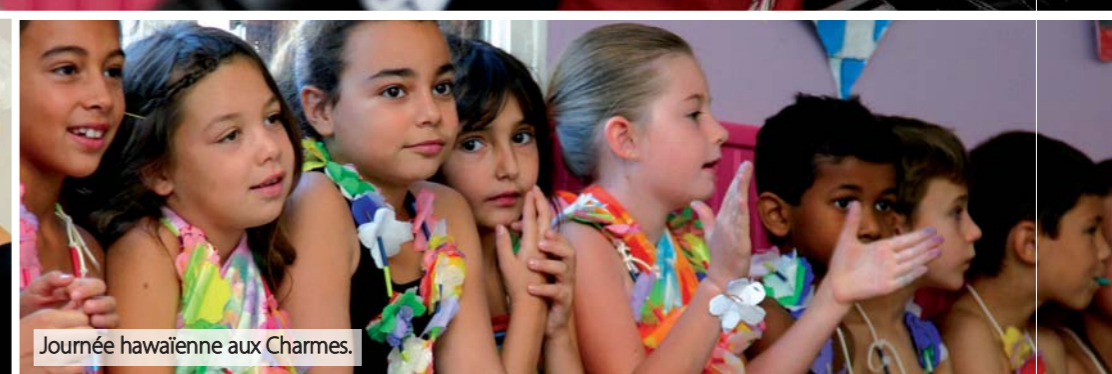
Journée hawaïenne aux Charmes.