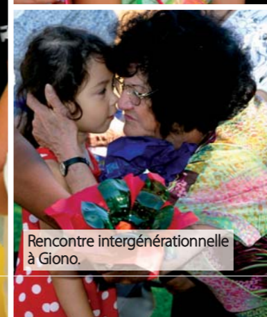
Rencontre intergénérationnelle à Giono.