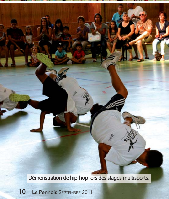
Démonstration de hip-hop lors des stages multisports.