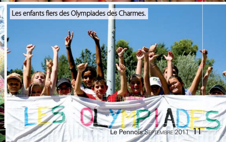
Les enfants fiers des Olympiades des Charmes.