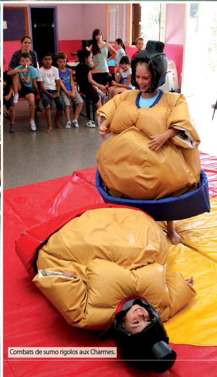
Combats de sumo rigolos aux Charmes.