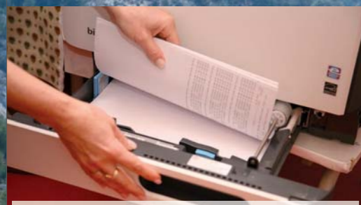
Des impressions recto/verso pour économiser le papier.

La municipalité n'a pas attendu : elle a organisé, ces dernières semaines, des ateliers éco-gestes pour son personnel.