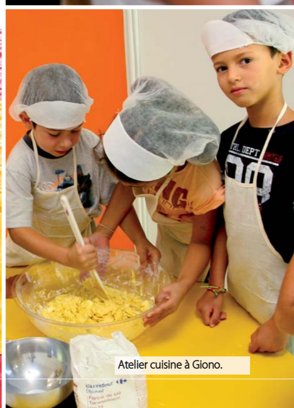
Atelier cuisine à Giono.