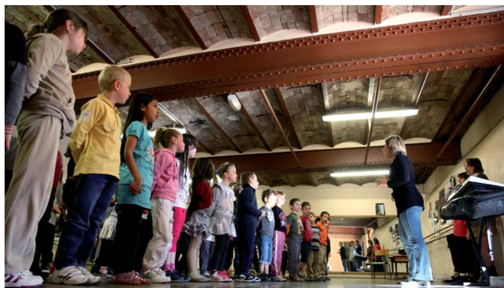
La chorale des enfants en répétition à quelques semaines du grand jour