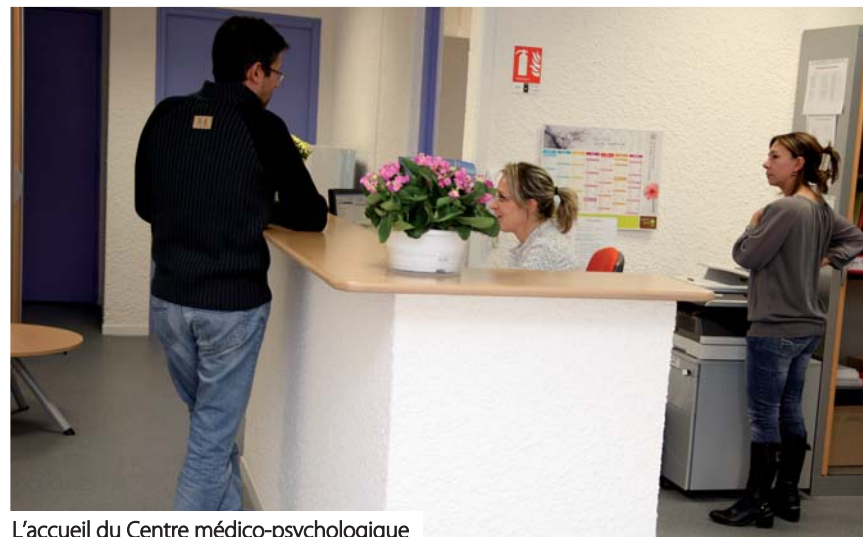
L'accueil du Centre médico-psychologique

Bonne nouvelle pour les Pennois : le centre médico-psychologique est ouvert et sera inauguré durant ce mois de février.