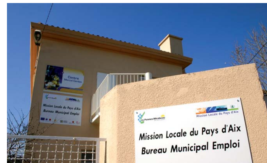
Le rendez-vous avec la création d'entreprise aura lieu dans les locaux du Bureau municipal de l'emploi

Le Bureau municipal de l'emploi des Pennes-Mirabeau organise le 17 février une rencontre destinée aux futurs créateurs ou repreneurs d'entreprise.