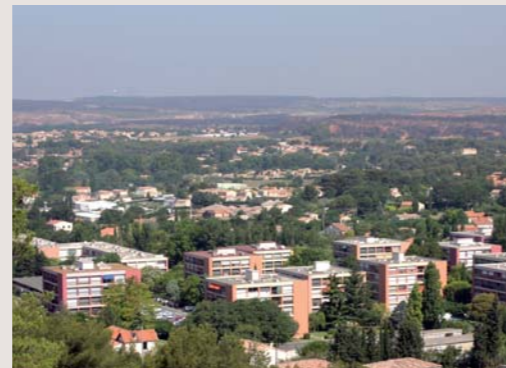
La Renardière, une résidence intégrée dans son environnement naturel