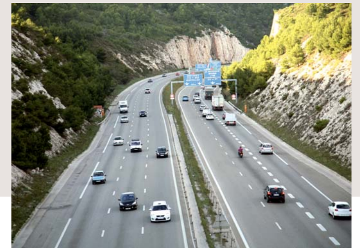
Améliorer les déplacements au profit des transports en commun