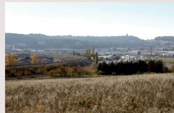
L'emplacement pour une gare ferroviaire et routière, à proximité de la voie ferrée Aix-Marseille, est déjà prévu