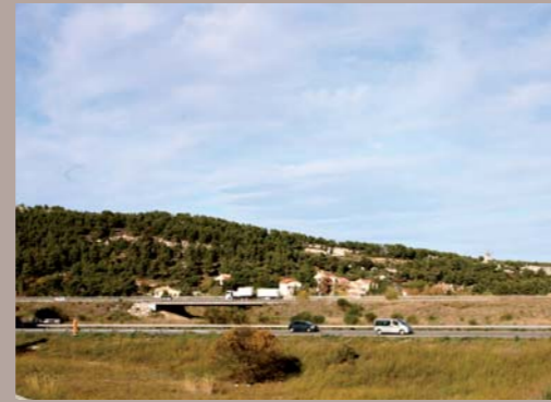
La barre des Pennes, un élément marquant du paysage de la commune à préserver

diminution de la voiture en ville, un pôle d'échanges multimodal (gare ferroviaire et routière) à proximité de la voie ferrée Aix-Marseille est une évidence, une priorité même... d'autant qu'un emplacement idoine existe face à la zone de Plan-de-Campagne ! Prévu au POS, ce pôle sera, évidemment, confirmé dans le PLU. Enfin, toujours dans cette volonté d'encourager les transports en commun, la ville souhaite-