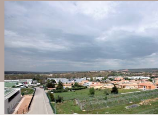
Pallières, symbole d'un quartier qui dans le futur saura faire rimer mixité et qualité