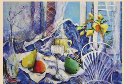
Lauréate 2007 : Sophie DISTRIA