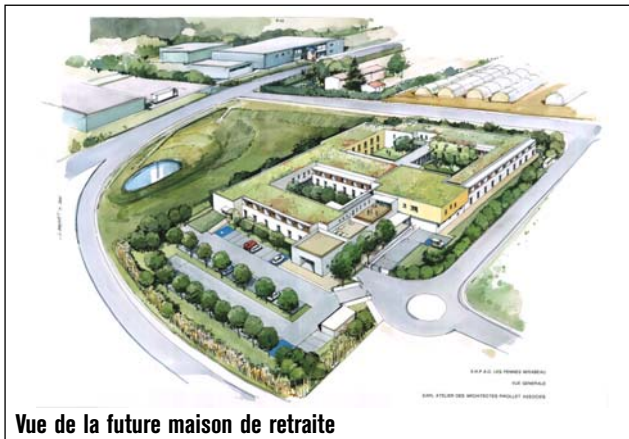
Vue de la future maison de retraite

harmonieuse, particulièrement performante en terme d'isolation pour éviter les nuisances sonores.