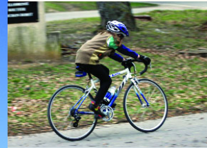
Vélodrome Louison Bobet