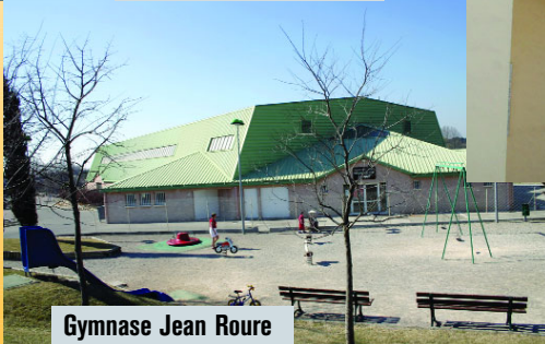
Gymnase Jean Roure