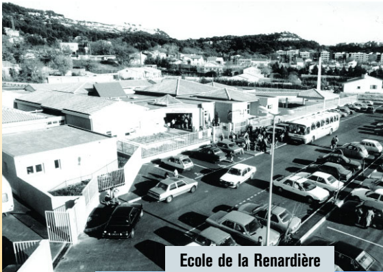
Ecole de la Renardière