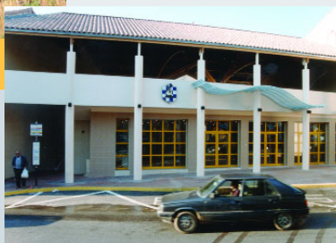
Salle du Jas'Rod