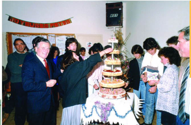
Au contact de la population dans les bons et les mauvais moments