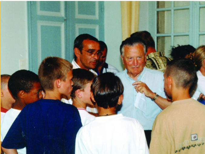
Un contact privilégié avec les jeunes

l'avenir de sa commune avait envisagé sa succession en ces termes qui sonnent comme un conseil", ces hommes ou ces femmes qui me succéderont un jour pourront, j'en suis sûr, continuer le sillon que j'ai tracé : avoir les meilleures idées pour Les Pennes-Mirabeau, prendre les bonnes décisions sans se soucier de consignes partisa-