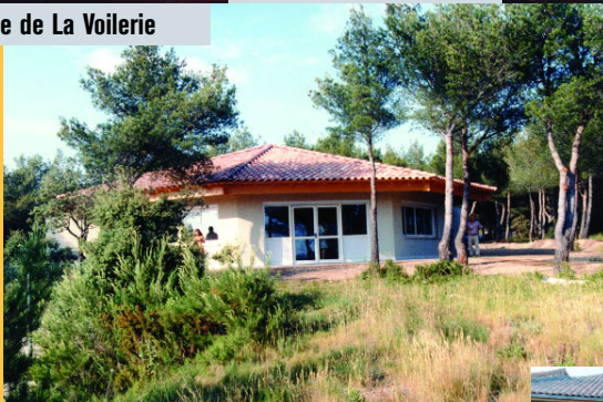
Commissariat de La Gavotte