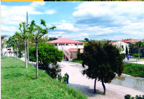
Judo club de la Gavotte