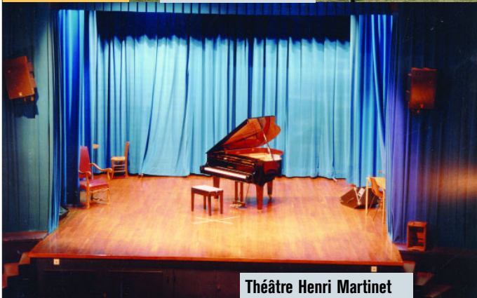
Théâtre Henri Martinet