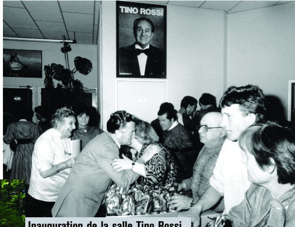
Inauguration de la salle Tino Rossi

ce qui a fait sa force, il a continué à creuser son sillon, toujours fort et fier de ses convictions. Ensuite, le maître n'est pas seulement devenu un conseiller. Il est devenu un ami, et c'est avec une certaine complicité que je l'ai retrouvé, après mon élection à la présidence du conseil général. Dois je dire que je ne m'habituerai pas à son absence, qui constitue, pour chacun de nous, une immense perte.