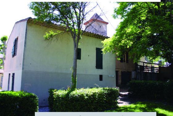
Il avait racheté le parc Jean Giono pour créer un espace vert à La Gavotte