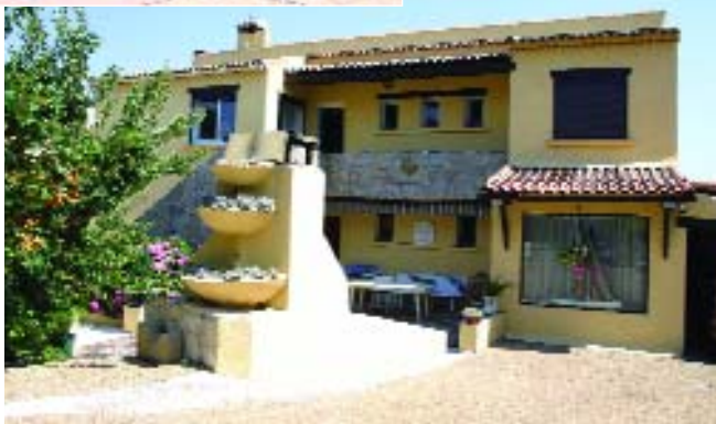
Georges Larangé propose un appartement en location saisonnière