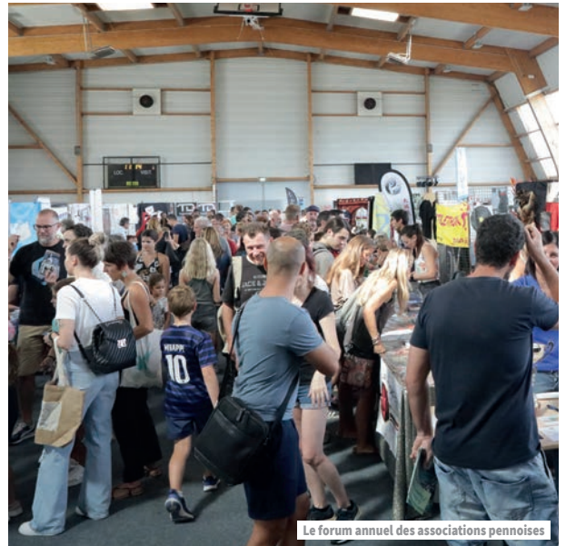
Le forum annuel des associations pennoises

Vie sociale, santé, solidarité, culture, loisirs, sport..., dans de multiples domaines, les nombreuses associations de notre commune s'adressent à toutes les générations de Pennois. Et cela est possible grâce à l'engagement de tous les bénévoles qui ne comptent jamais leurs heures ; nous voudrions d'ailleurs ici les remercier. Leur engagement et leur dévouement n'ont d'égal que leur passion et leur sens du partage.